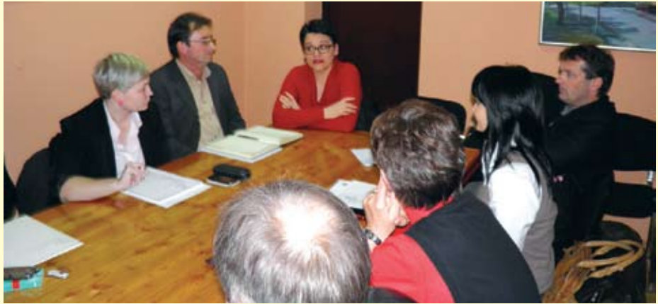
Sjednici Općinskog vijeća Radoboj održanoj 28. prosinca 2011. bili su nazočni i zastupnica u Saboru Republike Hrvatske Dunja Špoljar, te Anđelko Topolovec.

I troškovi općinske administracije znatno su smanjeni, jer je načelnik prešao na saborsku plaću pa ukupna sredstva za osobne dohotke zaposlenih u Općini sada iznose 484.800 kuna. Održavanje groblja