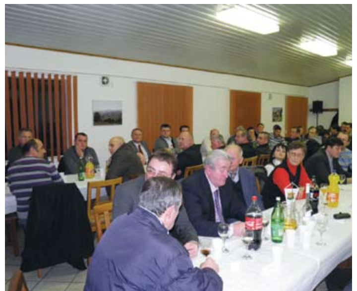
Nogometni klub Radoboj teško bi ostvarivao svoje rezultate da nema veliku pomoć Općine. Nije stoga neobično da su svečanoj sjednici prisustvovali i gotovo svi općinski vijećnici.