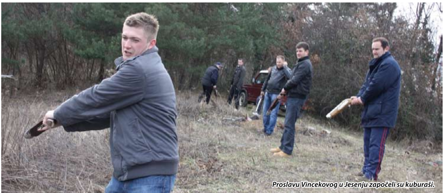
Proslavu Vincekovog u Jesenju započeli su kuburaši.

Godina je uvijek neizvjesna što se tiče vremenskih prilika, a u vinogradarstvu i vinarstvu priroda je iznad čovjeka te se molitvom Sv.Vinku obračamo kako bi zaštitio naše vinograde. Okupljene vinogardare i goste zabavljali su Strmosi, uz domjenak koji su, za sve prisutne, pripremili udruge i domaćin. A prema narodnoj uzrečici "Ak na Sv. Vinka sunce peče, najesen v lagve vino teče" ova godina mogla bi biti plodonosna, sudeći prema lijepom vremenu koje je bilo na Vincekovo.