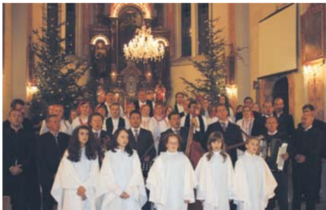
Izvođači na Božićnom koncertu.

Ove godine po prvi puta posjetiteljima se predstavila ženska vokalna skupina ovdajšnjeg KUD-a. Na koncertu su još nastupili glazbeni sastavi Podvinčani i Kavaliri, klapa Bistrica te dječji crkveni zbor Angeleki z rijeke Jordan, župe Gornje Jesenje. Izvođači su izvedbom božićnih pjesama oduševili posjetitelje kojih je ovaj puta bilo nešto manje nego što je uobičajeno, vjerojatno zbog lošijeg vremena te radnog dana u kojem je koncert održan.