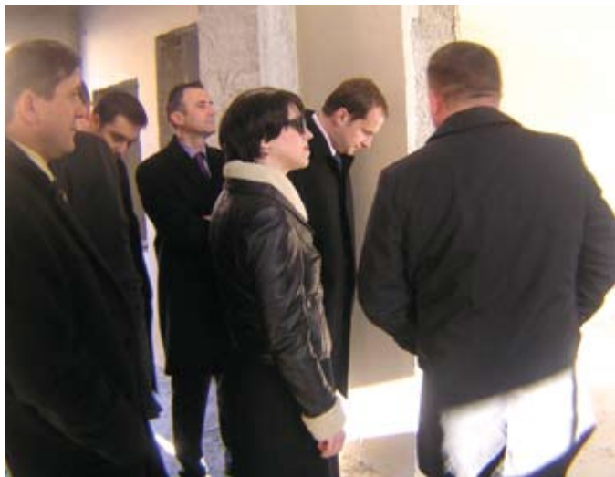
Razgledavanje prostora buduće Zavičajne zbirke.

Ministrica je potom sa suradnicima obišla prostore buduće Zavičajne zbirke i razgledala Radobojski trnac, da bi na kraju izjavila kako bi bila zadovoljna da i druge sredine toliku pažnju poklanjaju zaštiti okoliša i prirode. Obecala je i pomoć da se radobojski programi što prije realiziraju.