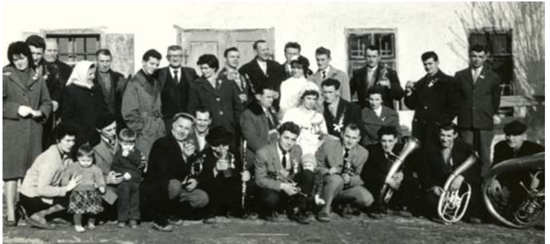
Svadbena slavlje prije pedeset godina nije moglo proći bez limene glazbe.

Radobojske mažoretke tako mogu biti bez brige