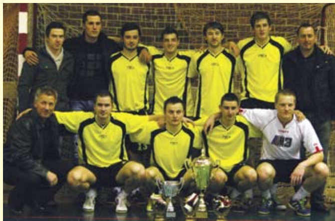
Pobjednička ekipa NK Radoboj.