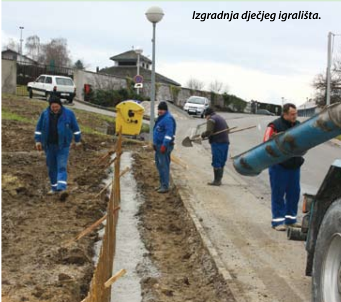
Izgradnja dječjeg igrališta.

Prema planiranom, igralište se gradi s istočne strane ulaza u centar Gornjeg Jesenja, pored mjesnog groblja. Na spomenutom zemljištu planirana je bila izgradnja vatrogasnog doma, ali se zbog trusnog terena odustalo od gradnje na toj lokaciji. Godinama neodržavano zemljište u vlasništvu DVD-a Jesenje, koje je zemljište ustupilo Općini postalo je predmet sudskog spora pa je time i prolongirana izgradnja igrališta. Uz igralište, na kojem će na postavljenim spravama zabavu naći oni najmlađi, dogradit će se parkiralište. Uz zelene površine bit će zasađeno ukrasno bilje, te će to biti svojevrsni parkić koji će se uklopiti u okoliš i stvarati lijepu sliku na samom ulazu u mjesto.