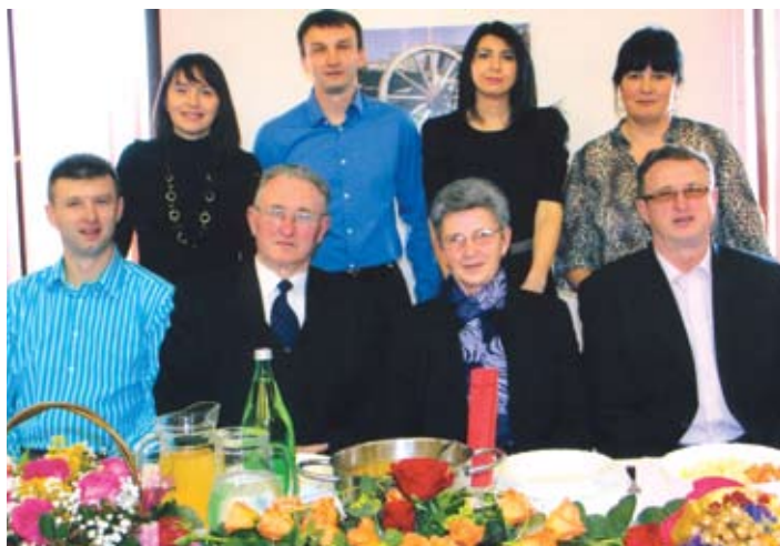
Slavljenici sa sinovima i snahama.

zdravlje i dalje posluži i da uz Božji blagoslov proslave i dijamantni pir uz svirku limene glazbe kao što je to bilo i prije pedeset godina na dan svadbe. (D. P. i V.R.)