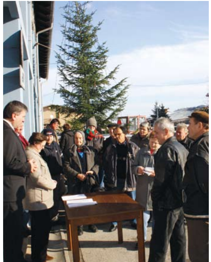
Podjela socijalnih paketa.

Uz pakete socijalno ugroženim mještanima, Općina je jednokratnom novčanom pomoći darovala 83 svoja umirovljenika u iznosu od 300,00 kuna.