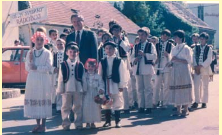
Kao ravnatelj OŠ Radoboj sa svojim je učenicima, mladim glazbenicima nastupao na mnogim manifestacijama. Slika je sa mimohoda krapinskim ulicama prilikom održavanja Tjedna kajkavske kulture.

Kao vrhunski glazbenik, unatoč određenom nepovjerenju u vojnim strukturama svira u orkestru Titove garde koji sudjeluje u svim ceremonijama ispraćaja i dočeka Predsjednika Josipa Broza Tita, a posebno mu je u sjećanju ostao boravak na brodu Galeb na koji su na susret s Titom dolazili ondašnji šefovi brojnih zemalja svijeta.