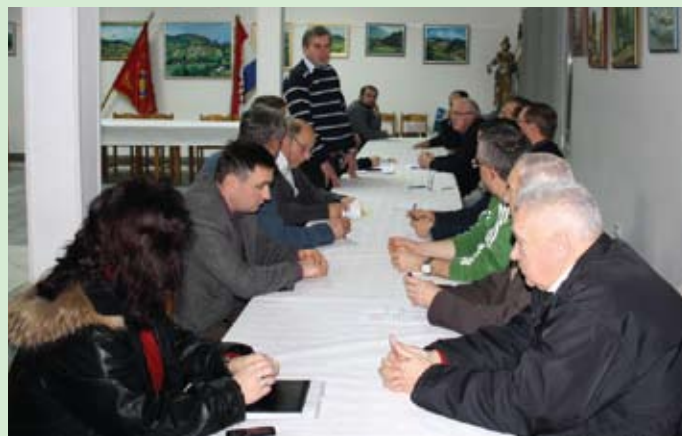
Sjednica Predsjedništva VZ KZZ.

Nakon radnog dijela, slijedio je prigodni domjenak i druženje za koje su se pobrinuli domaćini.