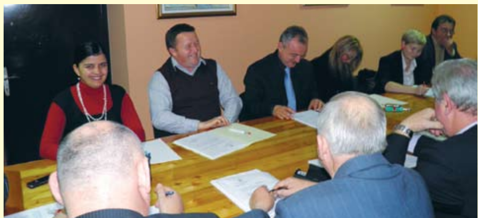
Radost na licima općinskih čelnika dokaz je dobro obavljenog posla kod donošenja proračuna za 2012. godinu. Proračun je prvi put u povijesti Općine donijet jednoglasno.

Tako je to predviđeno u proračunu Općine Radoboj za 2012. godinu, a realizacija ovisi o tome koliko će sredstava za programe u Radoboju predvidjeti proračuni Županije i Republike Hrvatske.