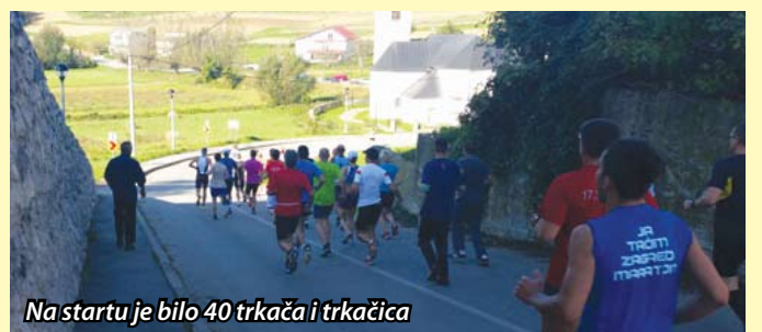
Na startu je bilo 40 trkača i trkačica