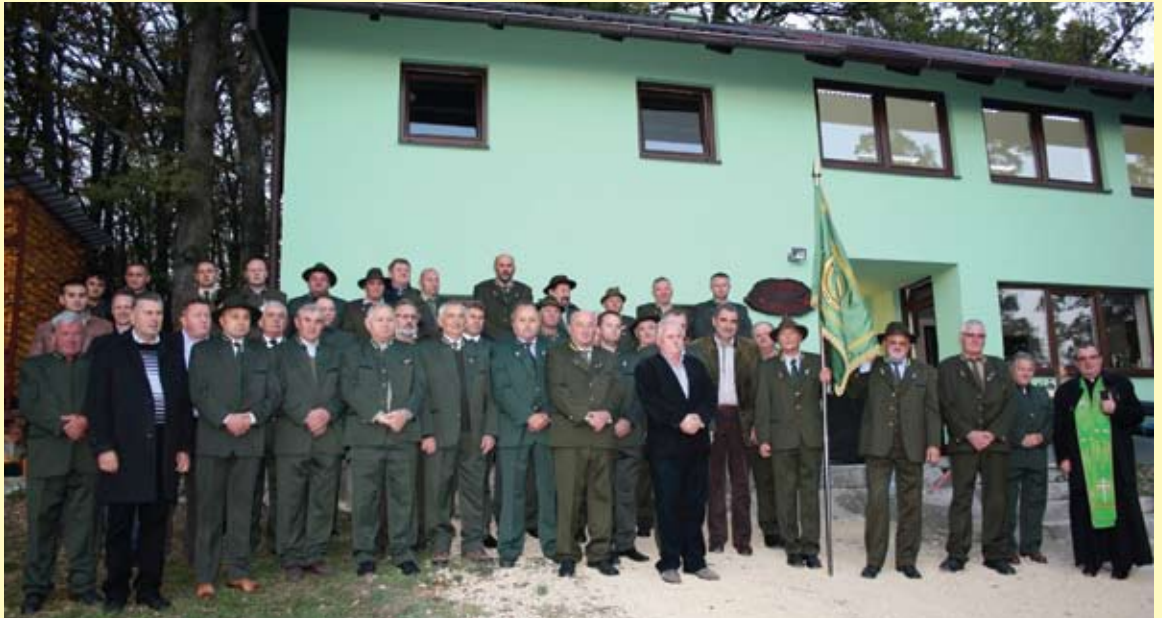
Radobojski lovci su zajedno sa uzvanicima proslavili svoj veliki dan