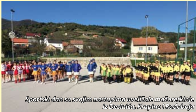
Sportski dan su svojim nastupima uveličale mažoretkinje iz Desinića, Krapine i Radoboja

U tjednu obilježavanja Dana općine Radoboj subota je bila rezervirana za sportsko - kulinarske susrete stanovnika Radoboja, Krapine i susjednih općina. Cjelodnevni program počeo je jutarnjim okupljanjem na igralištu i pripremom za natjecanje u kotlovnini koje je ove godine zabilježilo rekordan broj sudionika, odnosno čak 14 ekipa. Za vrijeme kuhanja kotlovnine održavale su se različite aktivnosti, od turnira u malom nogometu, bele i potezanja užeta do programa mažoretkinja. Mažoretkinje su svojim nastupom oduševile mnogobrojnu publiku, a manifestaciju su svojim sudjelovanjem obogatile gošće iz Krapine i Desinića. Najviše simpatija svakako je pokupila skupina najmlađih radobojskih mažoretkinja od kojih većina još ne pohađa ni osnovnu školu. Zabava je uz pjesmu domaćih izvođača trajala do mraka, a sve je završeno podjelom nagrada najboljim sudionicima. U potezanju užeta za muškarce najbolja je bila ekipa vinogradara i vinara Radobojski pajdaš koja je ujedno odnijela pobjedu i u malom nogometu. U kuhanju kotlovnine prvo mjesto dijelili su kuburaško društvo Viniverhska kubura i Savjet mladih općine Radoboj. Pobjedu u beli odnijela je ekipa općine Đurmanec dok su u potezanju užeta za žene najjače bile članice Društva naša djeca Radoboj.