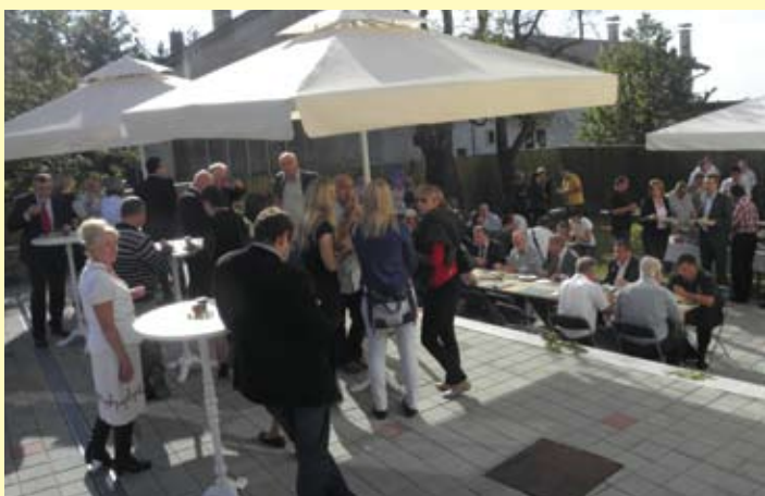
Druženje uzvanika nastavljeno je nakon završetka prezentacije