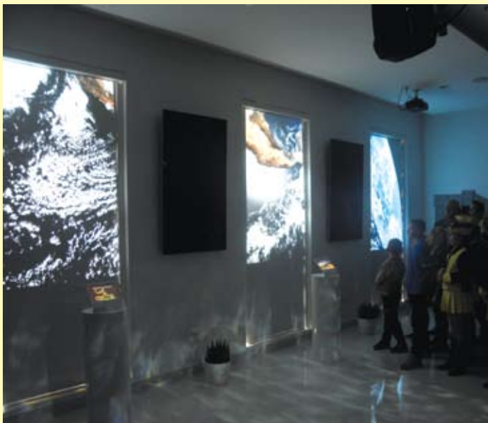
Spuštanjem zastora započinje multimedijalna prezentacija