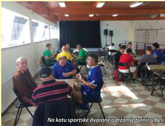
Na katu sportske dvorane održan je turnir u Beli