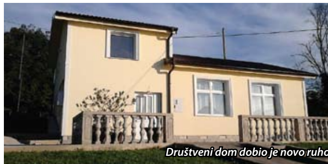
Društveni dom dobio je novo ruho

Akcijom građana očišćen je cjelokupni prostor oko doma, a sve nepotrebno je baceno u kontejner za krupni otpad kojeg je osigurala Općina. Radovi na fasadi su započeli tijekom rujna i završeni su u listopadu, tako da je Društveni dom dobio novi sjaj.