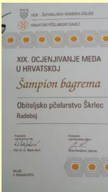
Plaketa za najbolji bagremov med

Stanovnici Radoboja mogu biti ponosni na još jednu činjenicu – u njihovoj se općini proizvodi najbolji bagremov med u Republici Hrvatskoj! Naime, na XIX. manifestaciji Dani meda 2014. koja je održana u Osijeku, u konkurenciji 102 uzorka za najbolji bagremov med proglašen je onaj Marijana Škrleca iz Jazvina. OPG Škrlec već tradicionalno na natjecanjima odnosi medalje, no biti najbolji u državi posebna je čast. Vrijedne ruke obitelji Škrlec imaju 290 košnica koje voze na ispašu po cijeloj zemlji, od Lonjskog polja na livadnu pašu i pašu Amorse, na Zrinsku goru na pašu kesteni, u Gorski kotar na pašu meduna odnosno šumskog meda, te u okolici Gračaca na pašu planinskog vrijeska. Ovim putem čestitamo obitelji Škrlec te im želimo još puno ovakvih uspjeha!