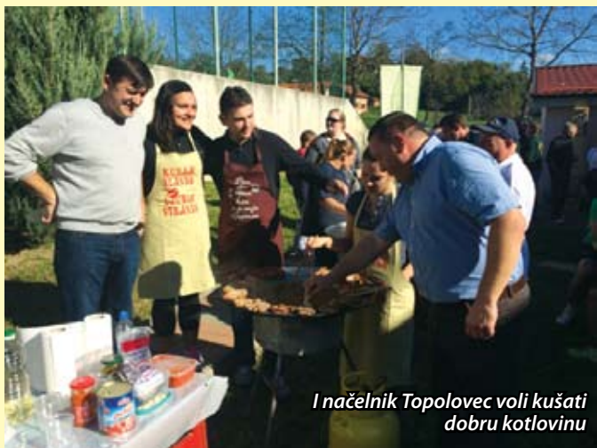
I načelnik Topolovec voli kušati dobru kotlovninu