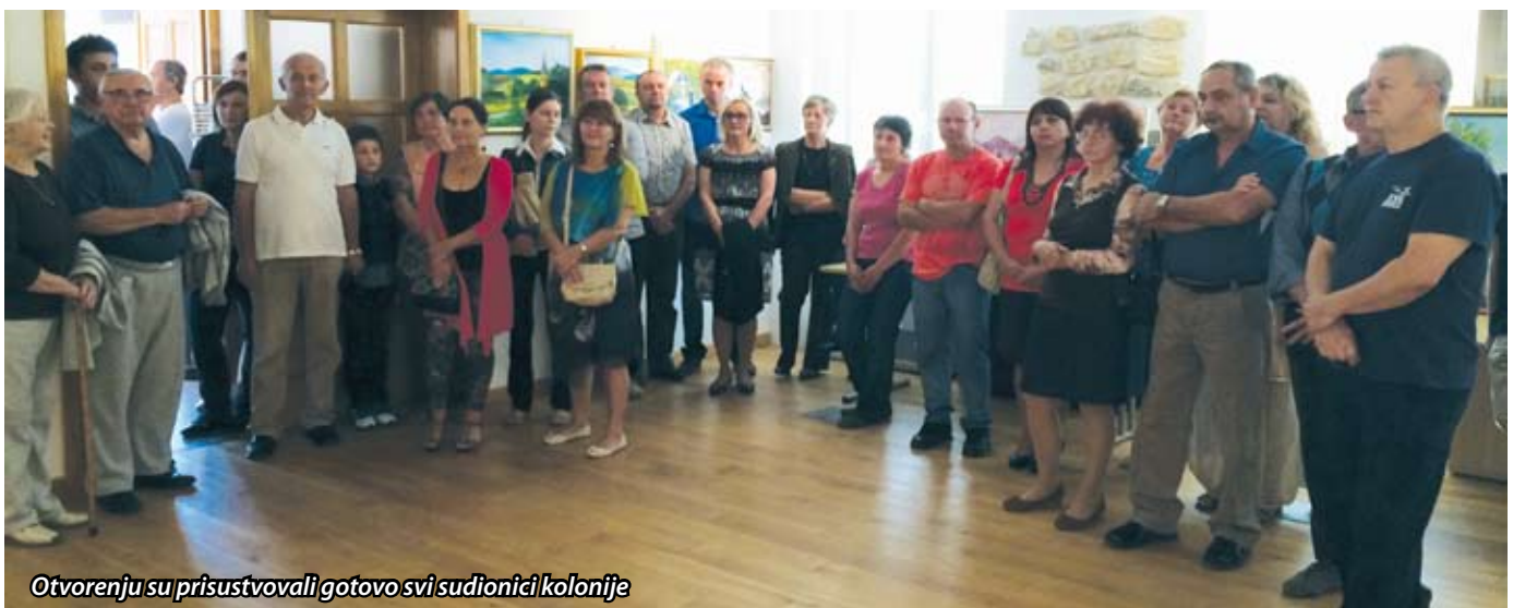
Otvorenju su prisustvovali gotovo svi sudionici kolonije