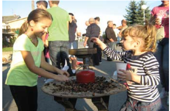
Pečene kestene kušali su i najmlađi posjetitelji