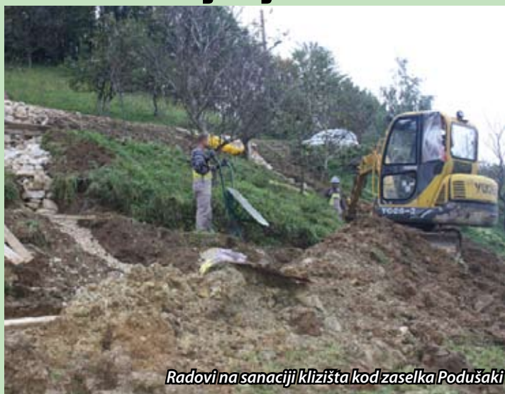
Radovi na sanaciji klizišta kod zaselka Podušaki

Strmi tereni i slojevita tla uzrok su nastajanja velikog broja oštećenja na nerazvrstanim općinskim cestama na području Općine Jesenje, a obilne ovogodišnje kiše uzrokovale su nastajanje klizišta većih i manjih razmjera, ulegnuća i puknuća asfaltnih kolnika tako da će za sanaciju nastalog stanja biti potrebno podosta financijskih sredstava, a i vremena. Zbog novonastalog klizišta na općinskoj cesti u zaselku Podušaki u Gornjem Jesenju, kojem je prijetilaž potpuna odsječenost obiteljskih kuća od glavne prometnice, zatraženo je stručno mišljenje te se započelo sa sanacijom nastalog stanja. Zbog mogućnosti nastanka klizišta većeg obujma dogovorena je hitna sanacija sa izvođačem „3BH“ čiji su djelatnici u vrlo kratkom roku, koliko su im vremenske prilike dozvoljavale radili na sanaciji terena.