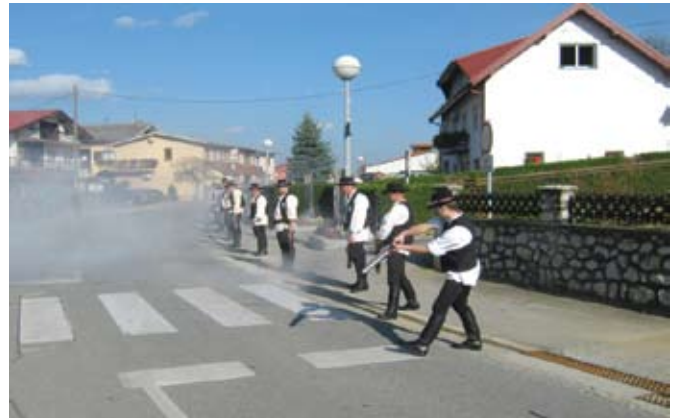
Kuburaši Jesejske kubure svojim su pucnjevima obilježili početak kestenijade

Za okrjepu su se pobrinuli članovi udruge vinogradara Sv. Martin koji su goste častili vinom i mladim moštom, a Općina je osigurala sokove. Sve koji su odlučili ovo lijepo jesensko popodne provesti kušajući ovu jesensku deliciju zabavljali su Podvinčani, a kasnije su im se priključili domaći muzikaši koji su već dobro raspoloženje okupljenih dodatno zagrijavali domaćim popevkama. Iako prva po redu manifestacija ovakve vrste koja je održana u Jesenju oduševila je posjetitelje, pa je već dogovorena sljedeća kestenijada godine.