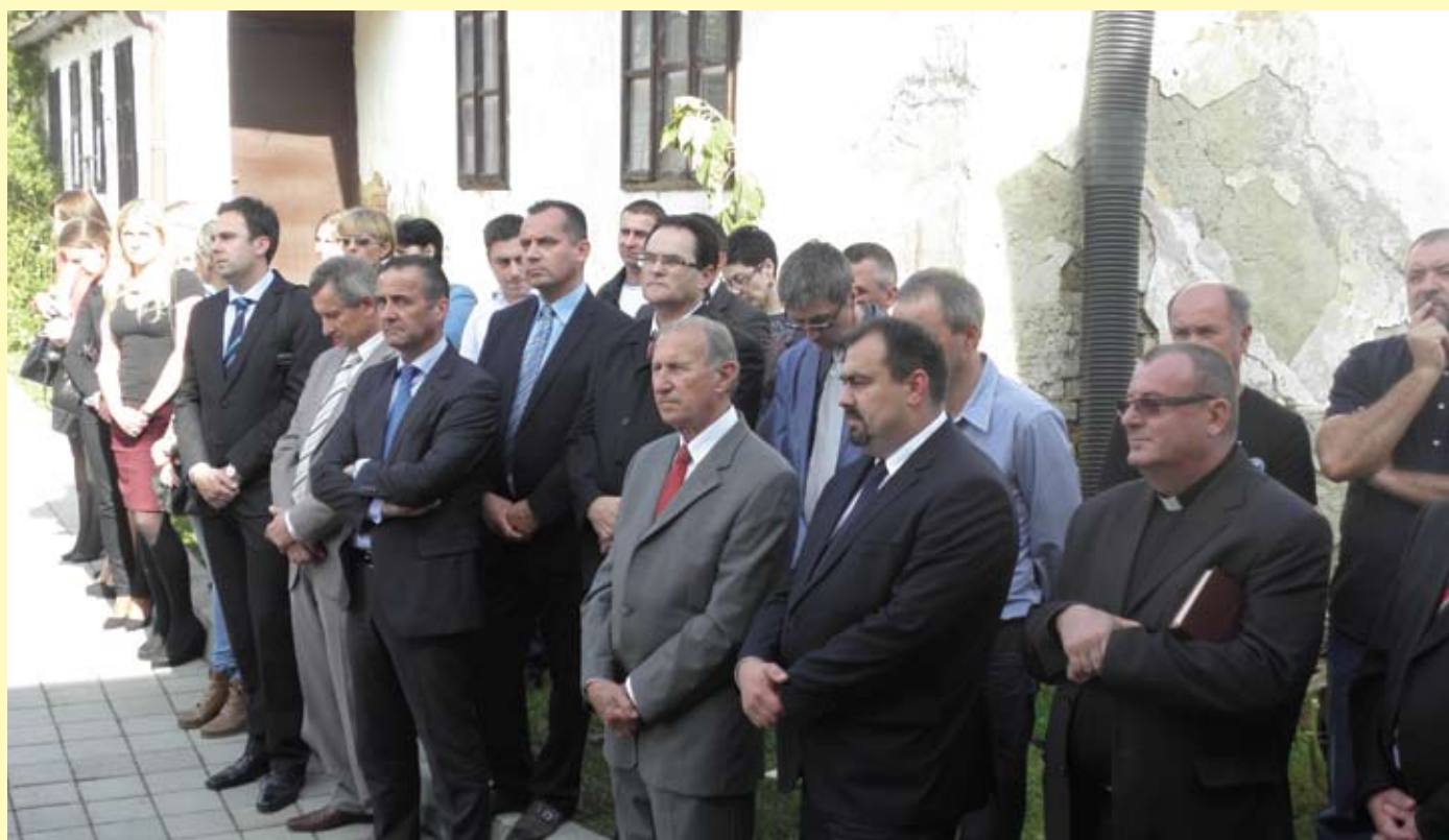
Uzvanici ispred Zavičajne zbirke

Sve u svemu, od Dana općine do Dana općine Radoboj značajno napreduje.