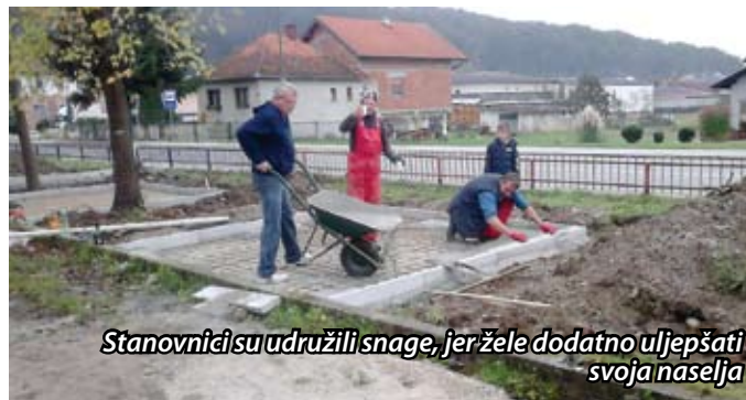
Stanovnici su udružili snage, jer žele dodatno uljepšati svoja naselja

Nakon održanih izbora i konstituirajuće sjednice u vrlo kratkom vremenu održana je prva, a krajem ljeta i početkom jeseni održane su još dvije sjednice vijeća novoformiranog Mjesnog odbora Jazvine i Orehovec Radobojski na kojoj su podijeljeni zadaci svim vijećnicima kako bi se odmah prišlo njihovom rješavanju te organiziranoj košnji zelenih javnih površina na cijelom djelu novog mjesnog odbora i izradi Plana i programa za slijedeću godinu. (Dragutin Gerić)