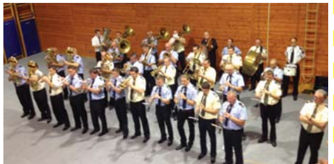
Povijesnim zajedničkim nastupom obiju radobojskih limenih glazbi obilježen je Dan Općine Radoboj

Povijest Radoboja teško se može zamisliti bez glazbe. Naime, pisana povijest o organiziranim glazbenim udrugama koje su djelovale u Radoboju seže još u doba početka 20. stoljeća, pa Radobojski s pravom mogu reći da imaju dugu tradiciju odgoja nadarenih glazbenika. U današnje vrijeme na području općine djeluju čak dvije limene glazbe, i to limena glazba „Mirna“ i limena glazba „Radobojska zvona“. Oba su sastava vrlo aktivna, a povodom Dana Općine ujedinili su snage i zajedničkim nastupom oduševili brojnu publiku. Stoga se nadamo da će se ulaskom novih, mlađih generacija u jednu i drugu glazbu konačno steći uvjeti za pomirenje nesuglasica te ujedinjenjem u jedan reprezentativni puhački orkestar, posebice zato što Radoboj to zaslužuje s obzirom na već spomenutu tradiciju i uspješnost mnogih glazbenika. Vodstvo Općinske također je obećalo punu podršku za nabavu instrumenata i angažiranje profesionalnog voditelja (kapelnika) kako bi se rad što više profesionalizirao. (rm)