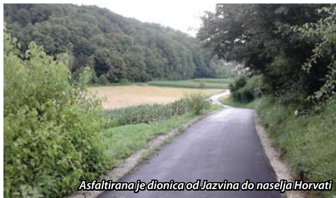
Asfaltirana je dionica od Jazvina do naselja Horvati

U navedenom periodu je drugim slojem asfalta presvučen preostali dio nerazvrstane ceste Jazvine – Horvati (Fruki) u dužini od 220 metara, te su uz taj dio uređene bankine.