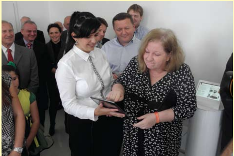
Ministrica kulture je pritiskom tipke na tabletu započela prezentaciju