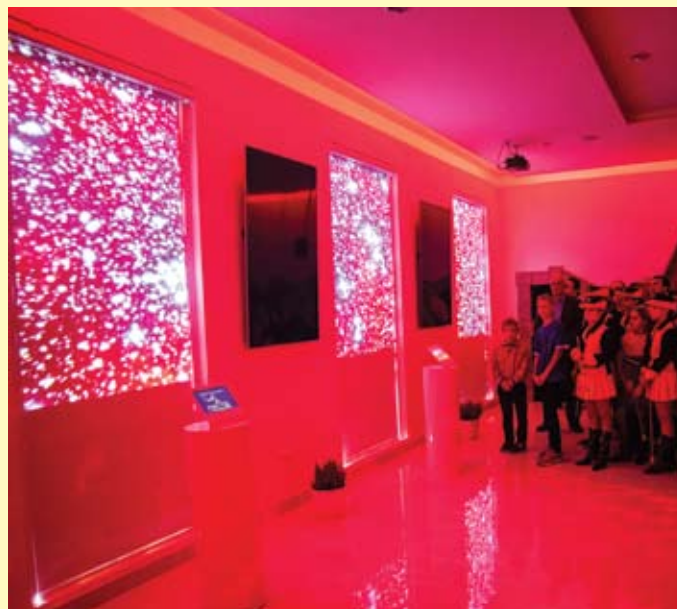
Zbirka je opremljena najmodernijom informatičkom tehnologijom