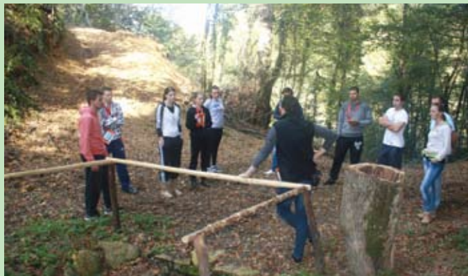
Uz predavanje valjalo je obići cijelu stazu

Program je osmišljen kao nastavak na dosadašnji projekt "Lovne staze krapinskih neandertalaca." Tako će posjetioći, kroz igru i zabavu, sudjelujući u raznim radionicama i igraonicama, imati priliku aktivno istraživati i otkrivati tajne krapinskog pračovjeka. Provedbom ovog projekta ponudit ćemo posjetiocima staze i Muzeja krapinskih neandertalaca dodatni sadržaj koji nadopunjuje trenutnu ponudu te smatramo da će taj program zasigurno privući dodatne posjetioce. Program obogaćuje već postojeće projekte, posebice "E-radnu bilježnicu" te će tako uz zabavu i poučne radionice zainteresirani naučiti puno više o neandertalcu i o njegovom životu. Spoj ovog programa s prijašnjim projektima od velike je važnosti jer će se tako kompletno upotpuniti ponuda na stazi te će biti zanimljivija za posjetioce različitih životnih uzrasta. Upravo radi toga što jedan projekt uvelike ovisi o drugom, članovi udruge "Jasen" ulažu maksimalan trud, volju i vrijeme da se projekt realizira i da staza bude spremna i otvorena za posjetioce na proljeće 2015. Informacije o daljnjem radu udruge možete pratiti i na web stranici www.jasen.hr . Ovim putem udruga "Jasen" također želi zahvaliti Krapinsko-zagorskoj županiji na odobrenom projektu i na donaciji.