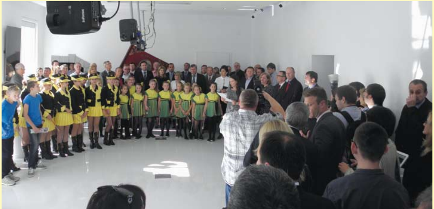
Službenoj prezentaciji prisustvovalo je mnoštvo visokih uzvanika i stanovnika Radoboja