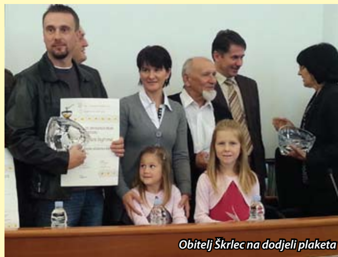
Obitelj Škrlec na dodjeli plaketa