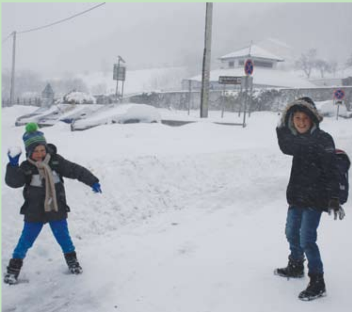
Maleni su uživali u snježnim radostima