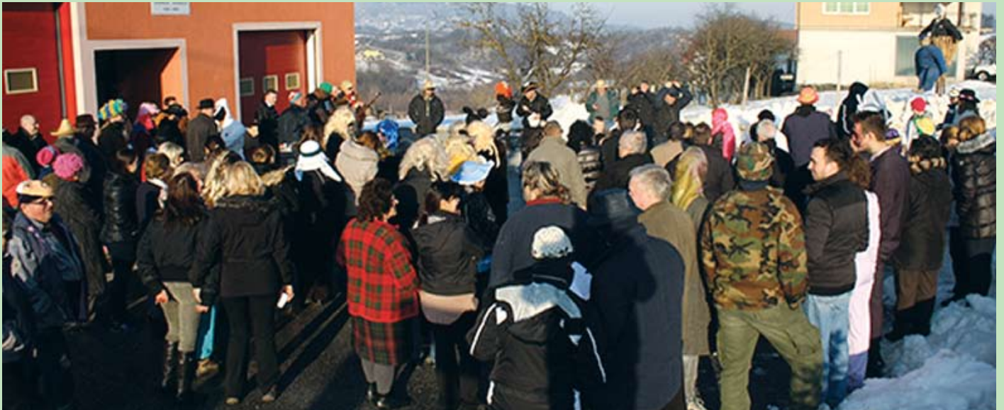
Završne fašničke špelancije održane su ispred vatrogasnog doma