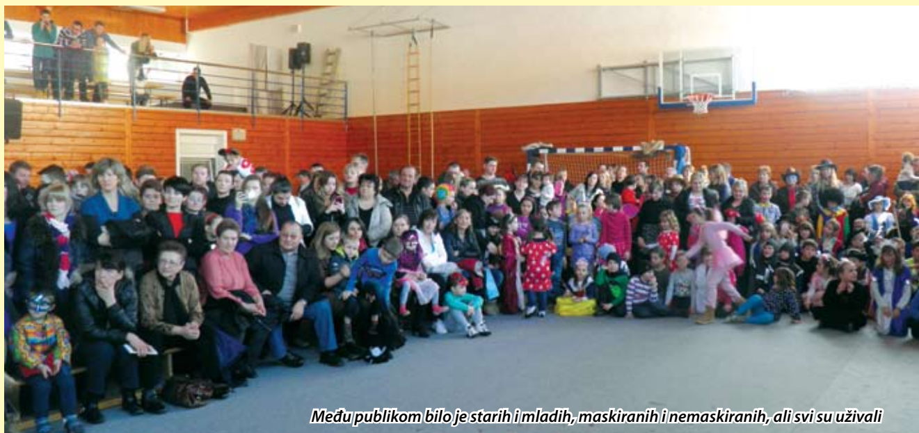
Među publikom bilo je starih i mladih, maskiranih i nemaskiranih, ali svi su uživali