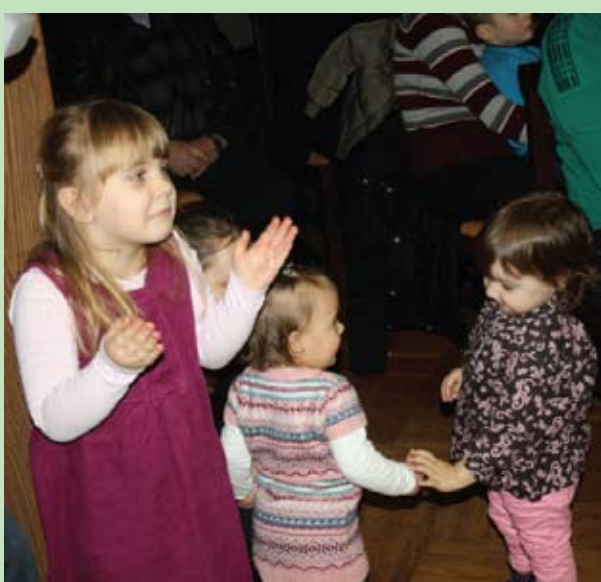
U predstavi su uživali i maleni