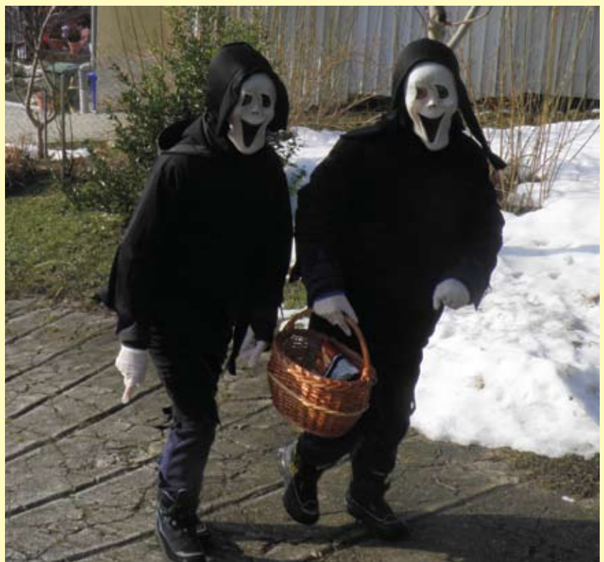
Dva po dva, tak je isplativije