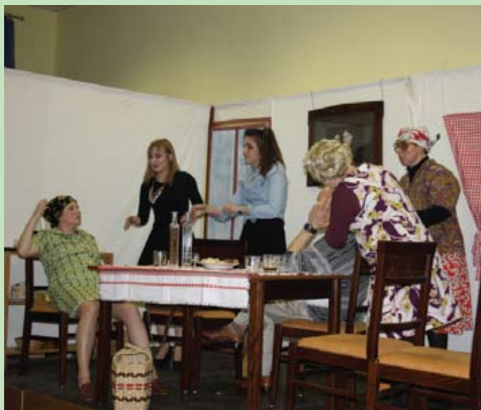
Scena sa predstave Više sreće drugi put