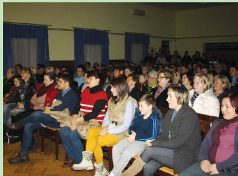
Dvorana je bila puna gledatelja koji su pljeskom popratili scene u predstavi