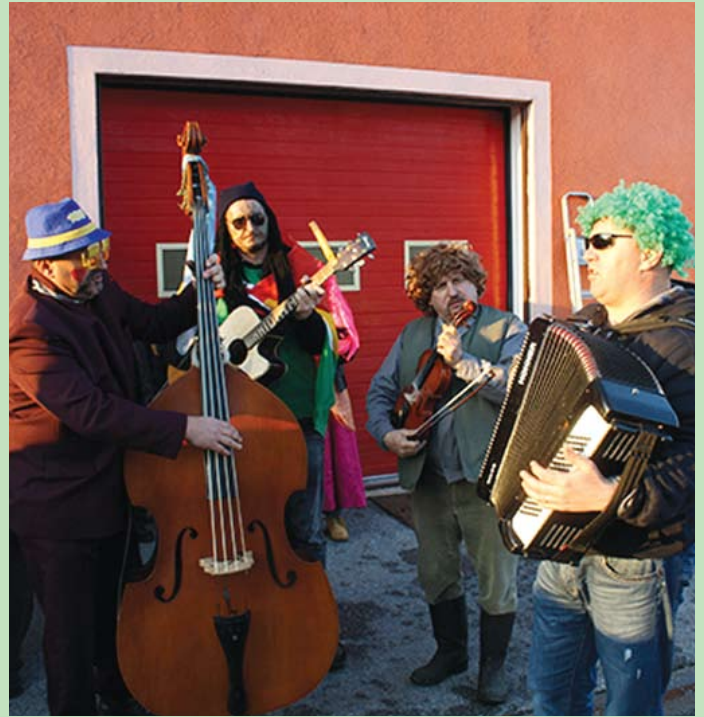
Muzikaši su se brinuli za dobro raspoloženje

U Jesenju je u nedjelju, 15. veljače, održana šesta po redu maškarada. U tradicionalnoj povorci našlo se mnogo maštovitih kreacija maski. Uz pratnju muzike, puno smijeha i zabave, maškare su traktorima i ove godine obišle sva naselja na području općine. Oduševljeni sumještani veseli su povorku častili pićem i krafnama i ostalim slatkim delicijama, tako da je dobro raspoloženje maškare pratilo cijelim putem. Uz pjesmu, ples i poneku pročitano dogodovštinu iz fašničkog listića Jesejanskog režička, obilazeći Donje Jesenje, Lužane, Vrbno, Cerje i Brdo, povorka se vratila u Gornje Jesenje. Pred više od 200 posjetitelja koji su se okupili ispred Vatrogasnog doma, održane su fašničke špelancije: izabrana je najbolja maska, osuđen i spaljen fašnik. Ove godine fašnik je u košu nosio teret prošlogodišnjih nedaća i greški, a one su, prema osudi, bile velike i teške te je on uz odobravanje svih okupljenih spaljen na lomači. Nakon špelancija održana je zajednička veselica svih okupljenih uz kuhane kobasice, krafne, vino i sok koje su pripremili organizatori pod pokroviteljstvom općine Jesenje.