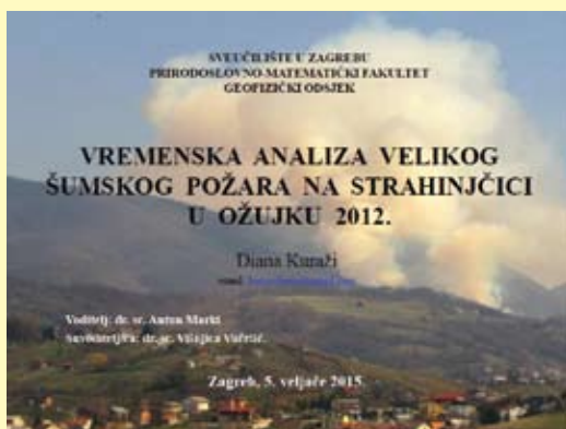
Naslovnica prezentacije diplomskog rada