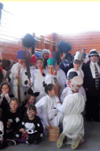
ostaje pa tako i radobojske maškare