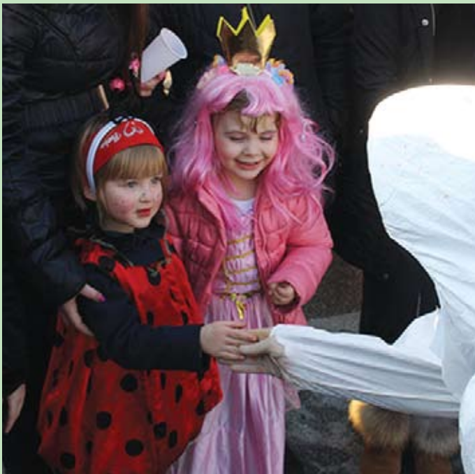
Maškaradi su prisustvovali i maleni