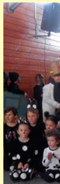
Na mladima svijet