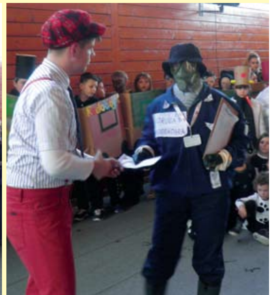
Po novim propisima v trsje se može samo ovako opremljen