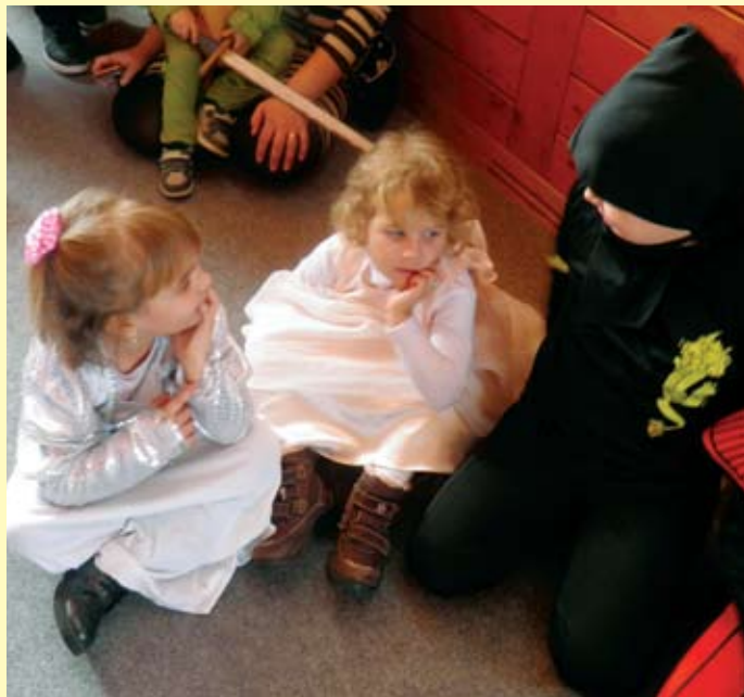
Bilo je i zamišljenih

Tradicija se nastavlja, jedni je nazivaju pokladni utorak, drugi fašnik, treći nekako drukčije, ali se uglavnom sve svodi na tradiciju maskiranja djece i odraslih s namjerom da se prikažu u drugačijem svjetlu nego što su to bez maske. Zahvaljujući Kulturno-umjetničkom društvu Zagorec Radoboj, OŠ Side Košutić , Općini Radoboj i brojnim pojedincima, u Radoboju se već godinama, uglavnom u nedjelju prije samog fašnika održava posebna priredba. Bilo je tako i u nedjelju 15. veljače 2015. U popodnevnim su se satima u sportskoj dvorani okupili maskirani učenici osnovne škole, članovi limene glazbe Radobojska zvona , maskirani odrasli mještani i veliki broj gledatelja. Učiteljice iz Jazvina, Radoboja i Gornje Šemnice i ove su se godine potrudile da uz izradu raznovrsnih maski i uvježbavanjem učenica i učenika na svojevrstan način prokomentiraju neki od aktualnih događaja. Iako je izostao veći broj odraslih maskiranih pojedinaca ili grupa bilo je originalnih nastupa, koje je publika oduševljeno pozdravila. Kako se to i priliči originalni i najbolji na kraju su dobili posebne nagrade, a za sve zainteresirane bilo je kuhanog vina, kobasica i drugih fašničkih specijaliteta.