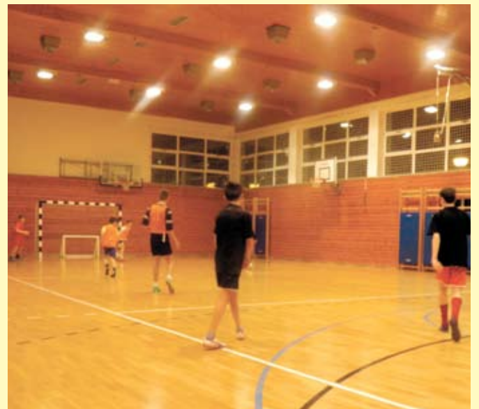
Detalj s treninga u sportskoj dvorani

Ako su treneru seniorske ekipe na raspolaganju trenutno 24 igrača, za juniore ima pravo nastupa 22, za starije pionire 16, mlađe pionire 15, limače 20 igrača kao i za veterane. Vidljivo je da kod pojedinih dobnih skupina kao što su pioniri nema dovoljno registriranih, jer u određenim godinama nema dovoljno rođenih koji imaju interes organiziranog igranja nogometa. Kako nema nikakvih zapreka da se naknadno registriira svaki zainteresirani, dovoljno je da, kako oni najmlađi tako i oni stariji, dođu na igralište prijave se treneru ili tajniku kluba i da bude se uključuje u aktivnosti NK Radoboj.