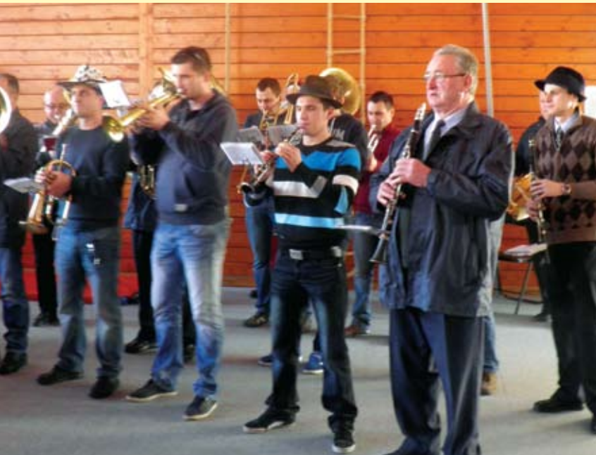
ka zvona, vjerni sudionik fašničkih spelancija