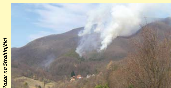
Požar na Strahinjčici