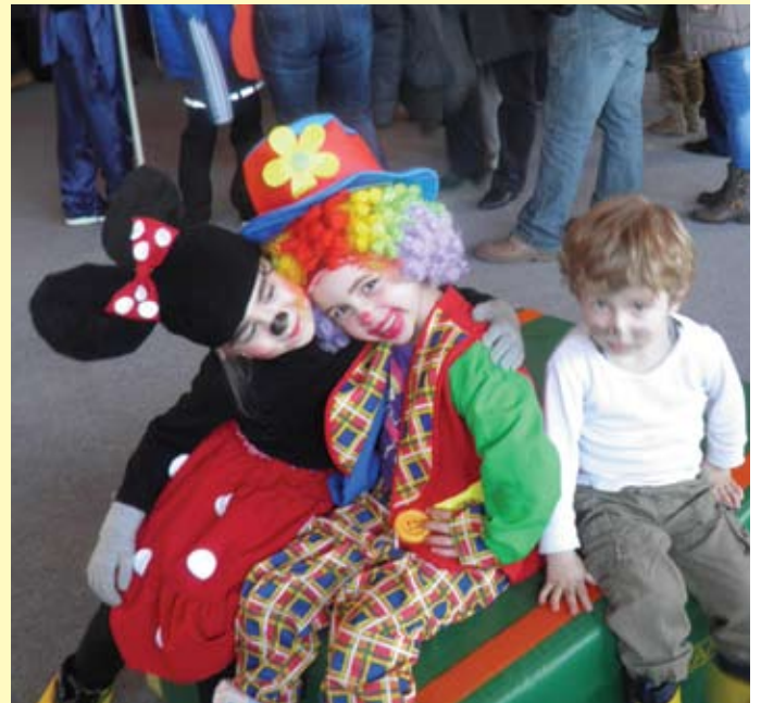
Tak smo male, a tak smo vesele