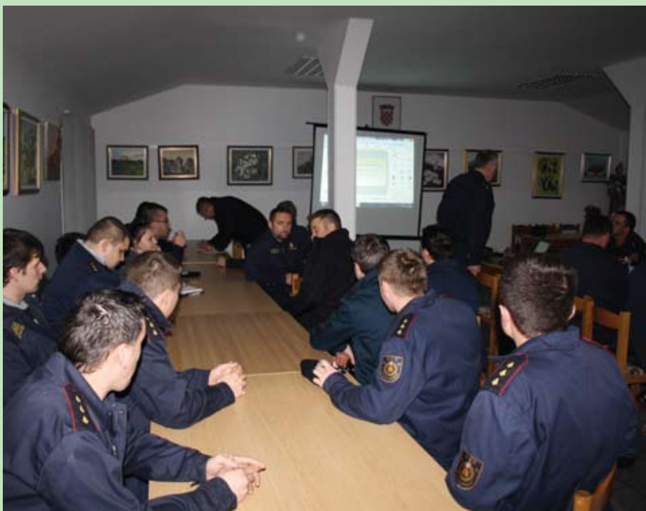
Na tečaju za vatrogasnog dočasnika I klase je sudjelovalo 44-vero vatrogasaca