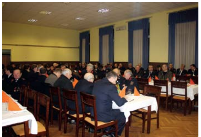
Skupštini DVD-a Jesenje prisustvovali su brojni gosti