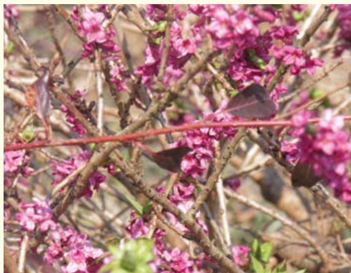
Likovac obični u punom cvatu na Strahinjčici

Legenda kaže da je ta prekrasna biljka tako rijetka da je neki kralj objavio proglas da onom koji je pronađe daje princezu za ženu. Šteta što ne znamo tko je taj kralj i važi li još uvijek ponuda, jer bi autor ovog članka vrlo rado provjerio istinitost ponude. Bilo kako bilo imamo razloga da se hvalimo još jednom biljnom vrstom koja je vrlo rijetka, ali se nađe i na našem području.