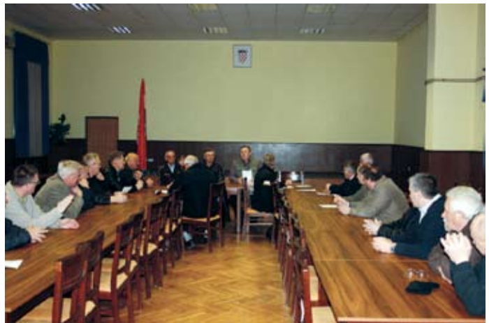
Skupština Udruge privatnih šumovlasnika

poboljšati kvalitetu svojih šuma, planira se nastaviti s aktivnostima otklanjanja otpada s manjih divljih odlagališta u šumama te uređenjem okoliša. Već sljedećeg dana organizirana je akcija izvlačenja posječenih stabala s padine podno župne crkve. Na akciju se odazvalo petnaestak članova udruge i mještana koji su u samo nekoliko sati izvukli veću količinu drva akacije koja je u jesen prošle godine bila posječena. U sljedećoj fazi planira se spaljivanje granja i priprema za vađenje panjeva akacije kako bi se ta padina uredila, a samim time okoliš crkve i župnog dvora dobio bi ljepši izgled.