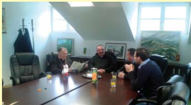
Razgovor u Općini Radoboj