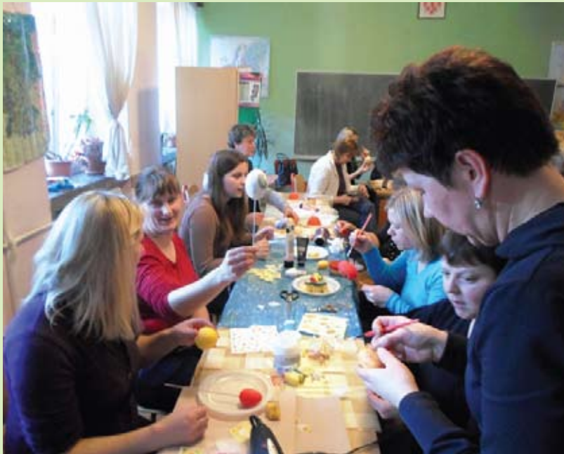
Radionica Šarena lica uskrasnih pisanica