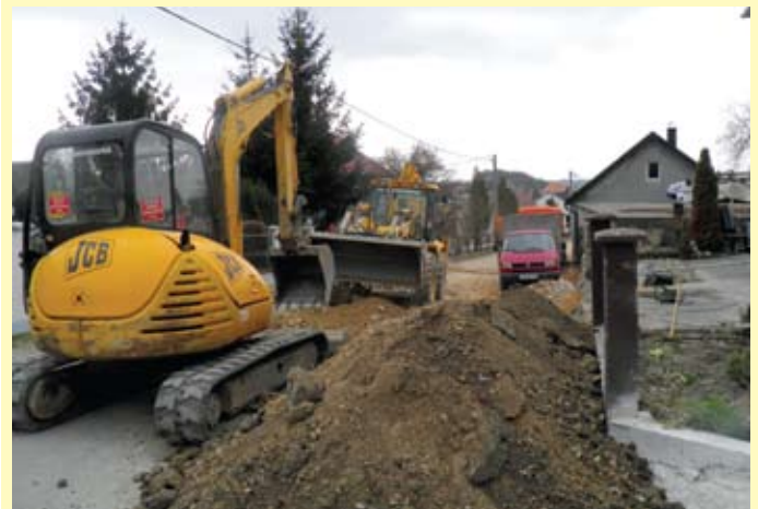
Radovi na rekonstrukciji radobojske dionice Rimske ceste intenzivno se odvijaju

Županijska uprava za ceste Krapinsko-zagorske županije financira rekonstrukciju Županijske ceste koja od Krapine preko Radoboja vodi prema Novom Golubovcu. Radi se o dionici od kružnog toka do starog bunara koji se nalazi prije uspona ceste prema zaselku Petrići, a koja do sada nije rekonstruirana. Kako ovaj dio ceste prolazi između obiteljskih kuća bilo je dosta problema kako bi se sama trasa ceste proširila i izradio nogostup. Vlasnici su pristali na rušenje ranije postavljenih ograda i proširenje kolnika pa su stvoreni uvjeti za izgradnju suvremene prometnice. Usporedno s proširenjem kolnika i izgradnjom nogostupa obavljaju se opširni radovi na odvodnji oborinskih voda, postavljaju se nove vodovodne cijevi mnogo većeg profila nego što su to stare, radi se na rekonstrukciji javne rasvjete i kanalizacije. Kako se radi o vrlo zahtjevnim radovima u kojima sudjeluje više korisnika, prometnica je svakog radnog dana za vrijeme odvijanja radova zatvorena za promet, pa se koriste zaobilazni pravci.