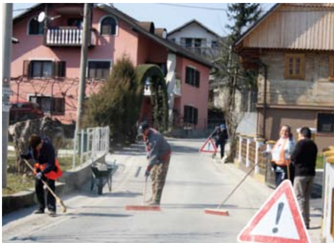
Zaposleni na javnim radovima

I ove je godine osobama koje su već duže vrijeme prijavljene na Zavodu za zapošljavanje pružena mogućnost zapošljavanja kroz mjeru Javnih radova koju provodi Hrvatski zavod za zapošljavanje u suradnji s općinom Jeseje. Iako se ugovor sklapa na određeno vrijeme, broj zainteresiranih sve je veći. Trenutno su putem javnih radova zaposlene četiri osobe na rok od šest mjeseci. Dolaskom toplijih, sunčanih dana zaposleni su počeli uklanjati šoder s nogostupa i prometnica kojeg je u većim količinama ostalo od zimskog posipavanja. Nakon toga nastavit će se s radovima na uređenju autobusnih stajališta, uređenju okoliša, zelenih površina i sitnim komunalnim radovima. Ovim mjerama dugotrajno nezaposlenim barem će šest mjeseci biti osigurana primanja.