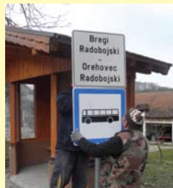
Autobusno stajalište Bregi Radobojski - Orehovec Radobojski u smjeru Krapine.

Mještani Brega Radobojskih i Orehovca Radobojskog koji su na autobus dolazili i iz njega izlazili na stajalištu Marof pokrenuli su inicijativu za promjenu naziva tog autobusnog stajališta. Napomenuli su da naziv Marof nema nikakvo posebno značenje, jer mjesto s takvim nazivom ne postoji. Predložili su da se stajalište preimenuje i da se označi kao autobusno stajalište Bregi Radobojski - Orehovec Radobojski. Općinsko vijeće Općine Radoboj prihvatilo je inicijativu i nakon što su ishođene potrebne dozvole i odobrenja ovih je dana postavljena natpisna ploča. Ujedno je sukladno s prometnim elaboratom stajalište prema Radoboju pomaknuto pedesetak metara prema Radoboju, a ono za Krapinu je ostalo na istom mjestu. Osigurana je tako veća sigurnost putnika, a dobili su eto i novo ime stajališta.(b.o.)