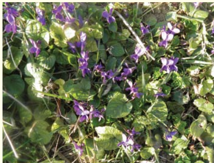
Koliko je naše područje još uvijek zaštićeno od zagađenja i drugih ugroza dokaz je i ovo cvjetno polje jaglaca i busen plavih ljubičica.