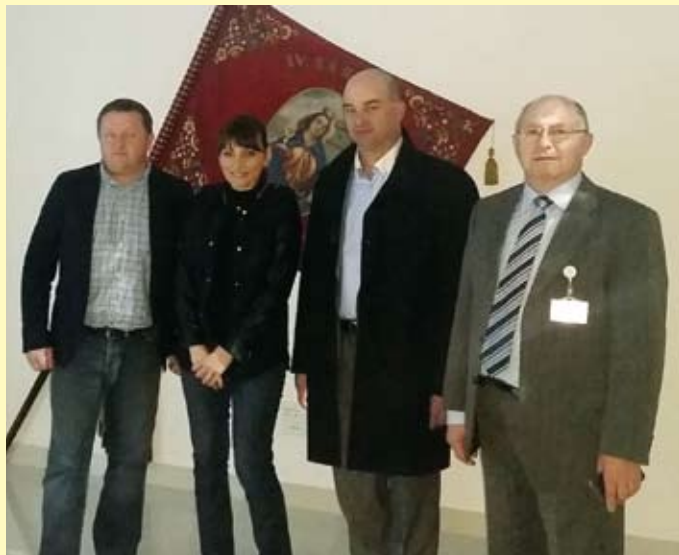
Predstavnici Ministarstva gospodarstva u Općini Radoboj

Uz razgledanje obnovljenih zgrada u vlasništvu Općine Radoboj gosti iz Ministarstva gospodarstva razgledali su Zavičajnu zbirku i Edukacijsko-promidžbeni centar Javne ustanove za zaštitu prirode Krapinsko zagorske županije.(ss)