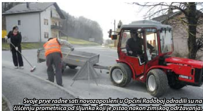
Svoje prve radne sati novozaposleni u Općini Radoboj odradili su na čišćenju prometnica od šljunka koji je ostao nakon zimskog održavanja.

Svoje prve radne dane privremeno zaposleni odradili su na čišćenju nogostupa i prometnica, a svojim će radom doprinijeti uređenju javnih površina i ljepšem izgledu okoliša na cijelom području Općine Radoboj. Pravo na privremeno zapošljavanje na obavljanju javnih radova imaju osobe koje su prijavljene duže vrijeme na Zavodu za zapošljavanje.