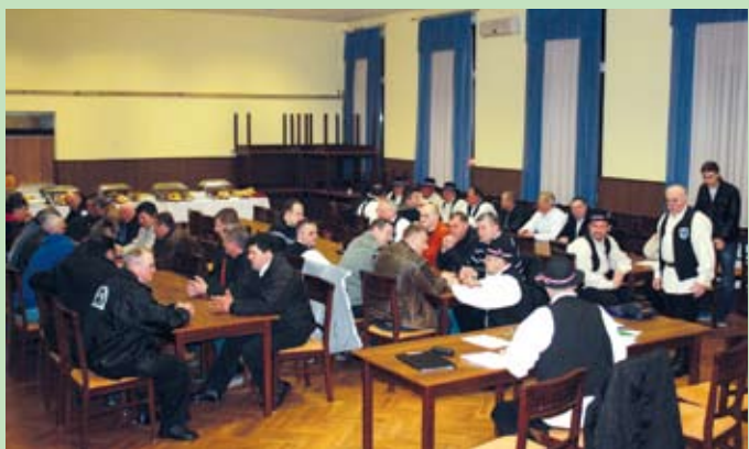
Skupština udruge kuburaša