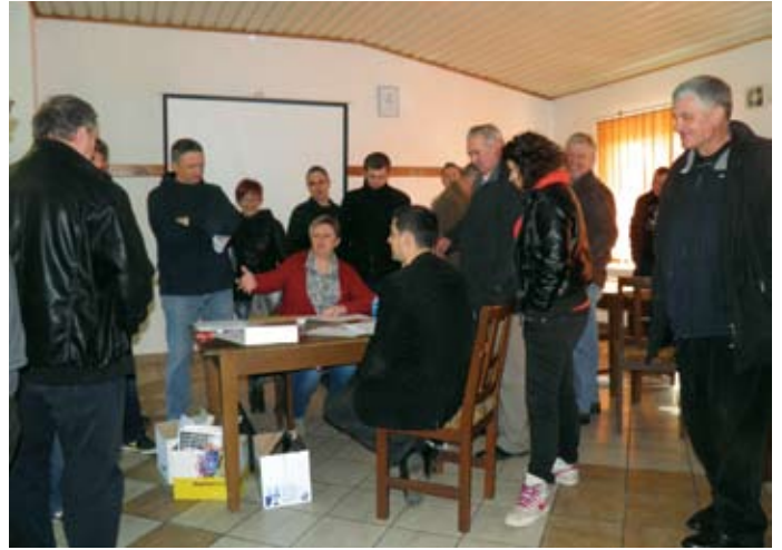
Polaznici tečaja s nestrpljenjem su očekivali rezultate ispita

Nakon petnaest sati nastave polaznici tečaja prišli su polaganju ispita i svi koji su uspješno dokazali znanje o sigurnom rukovanju s pesticidima i njihovoj primjedbi dobit će odgovarajuće iskaznice na temelju kojih će iduće tri godine moći kupovati sredstva za zaštitu. Ukoliko se ukaže potreba ovakav tečaj organizirati će se u Radoboju ponovno.(vir)