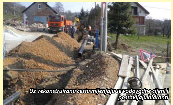
Uz rekonstruiranu cestu mijenjaju se vodovodne cijevi i postavljaju hidranti

Završetkom radova na rekonstrukciji ove dionice Rimske ceste Radoboj će u duljini od oko 800 metara dobiti moderno uređenu i za promet sigurnu cestu koja će po svim karakteristikama imati obilježje gradske ulice. Treba također napomenuti da se uz polaganje novih vodovodnih cijevi postavljaju i hidranti pa će taj dio Radoboja imati potrebne instalacije na planu zaštite od požara. Rekonstrukciju ceste financira Županijska uprava za ceste, rekonstrukciju vodovodne mreže Krapinom, a postavljanje nove javne rasvjete Općina Radoboj.(vir)