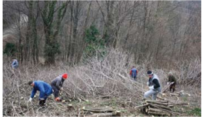
Radna akcija šumovlasnika

Na godišnjoj izvještajnoj skupštini udruge privatnih šumovlasnika „Jela“ Jesenje u petak 13. ožujka u dvorani Doma kulture okupilo se tridesetak članova i njihovih gostiju. Predsjednik udruge Stjepan Kovačec istaknuo je kako je udruga provodila aktivnosti vezane uz utvrđeni program rada za protekli period. Šumovlasnici su u protekloj godini kupili još jedan cjepač drva kojim će se koristiti članovi koji imaju traktore manjih snaga. Provodili su aktivnosti uređenja okoliša vezanih uz Dan planeta Zemlje prilikom kojih je u suradnji s ostalim udrugama očišćeno nekoliko manjih deponija. Organizirano je pokazno predavanje vezano uz uzgojne radove u šumama te stručno - edukativni izlet kojeg su šumovlasnici organizirali s udrugom vinogradara. U programu rada za tekuću godinu šumovlasnici nastavljaju s aktivnostima vezanim uz edukaciju svojih članova kroz razna predavanja vezana za korištenje sredstava iz EU fondova, kako