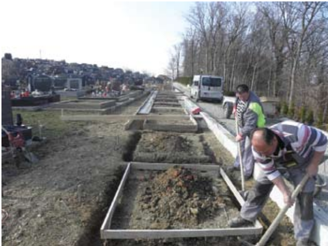
U tijeku je izgradnja betonskih okvira za novih pedesetak grobnih mjesta na mjesnom groblju u Radoboju.

Zahtjeve za dodjelu grobnih mjesta na korištenje zainteresirani mogu podnijeti Upravnom odjelu Općine Radoboj.(B.O.)