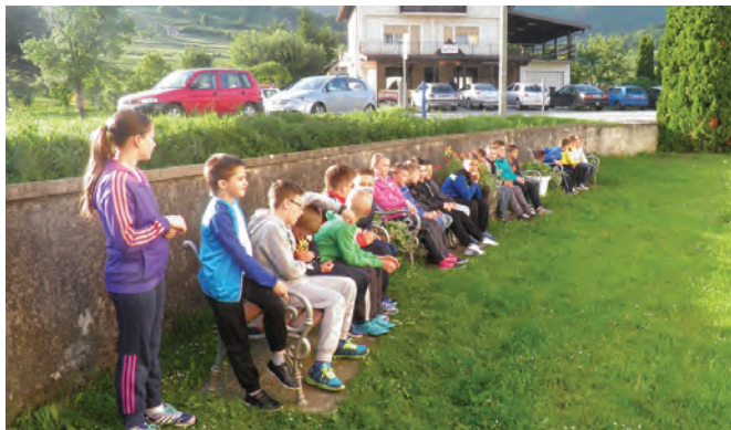
Sportaši Hrvatskog zagorja prije Sv. mise okupili su se ispred Župne crkve u Radoboju

Bogu na zdravlju i mogućnostima da se bave sportom i da uspjehe ostvarene kroz natjecanja shvate prije svega kao pobjedu vjere u Boga, te da se stoga nije potrebno moliti za ostvarivanje velikih rezultata kao sportaša već kao pobjedu vjernika privrženog ka-