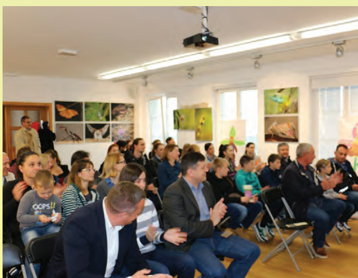
Većina aktivnosti u okviru manifestacije „Putevima orhideja“ krenula je iz Centra za prirodu „Zagorje“ u Radoboju