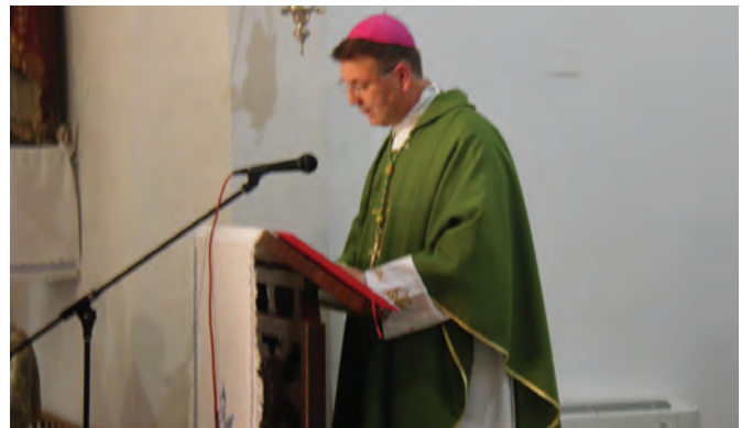
Euharistijsko slavlje u crkvi Presvetog Trojstva predvodio je mons. dr. Ivan Šaško, pomoćni biskup zagrebački

toličkoj crkvi. Pohvalivši početni korak učinjen u Radoboju izrazio je nadu da će već iduće godine na euharistijskom slavlju posvećenom uspjesima zagorskih sportaša u Radoboju biti predstavnici brojnih sportova, a ne samo nogometaša kao što je to ovaj put