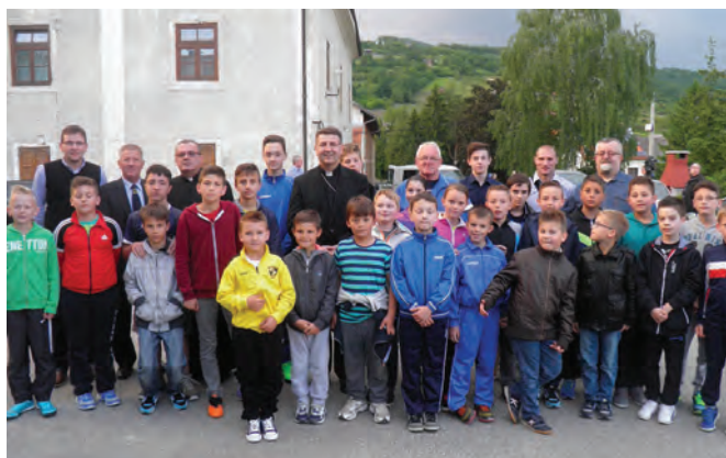
Druženje sportaša Hrvatskog zagorja nastavljeno je kod Župnog ureda, a nije izostalo ni zajedničko fotografiranje

vom planu, a tek onda postignuti rezultati, spomenimo da je prvo mjesto pripalo prvoj ekipi Župe Presvetog Trojstva Radoboj, drugo predstavnicima Župe Sv. Marka Križevčana iz Zagreba, a treće prvopričesnicima iz Župe Sv. Vid, Brdovec. (vir)