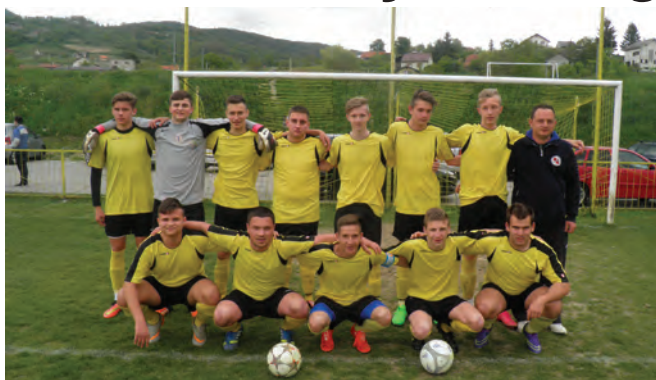
Ekipa juniora bori se za ostanak u I. ŽNL

Nakon dosta lošeg dijela natjecanja u Međužupanijskoj nogometnoj ligi - središte, nogometaši NK Radoboj uspjeli su odigrati nekoliko dobrih utakmica. Izgubivši u gostima od NK Gradići 1:5 i na svojem terenu od Dinama 1:2 uslijedio je preokret. Najprije su u Zaboku protiv Mladosti odigrali 1:1, zatim su pobijedili u Savskom Marofu 3:2 da bi u Radoboju dobili Ogulin 5:0. Na žalost u nedjelju, 29. svibnja u