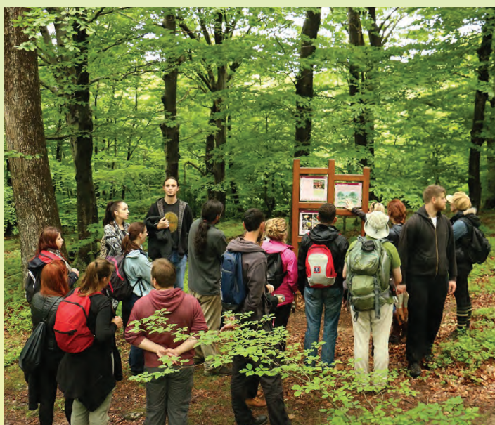
Posjetitelji na obilasku puteva orhideja

po zagorskim bregima?“ Mladena Zadravca sa prikazom zabilježenih zmija u KZŽ, te korisnim savjetima i upozorenjima što bi trebali uraditi prilikom susreta sa zmijama. Kao vrhunac manifestacije organiziran je obilazak Planinarsko-poučne staze „Putevima orhideja“ uz stručno vodstvo na kojoj su sudionici mogli uživo vidjeti 15 vrsta orhideja te brojne druge životinjske vrste. Zajedničko druženje završeno je uz ručak u Lovačkom domu. Javna ustanova posebno zahvaljuje: