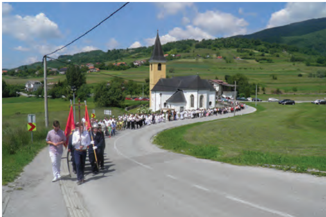
Nakon Sv. mise u Župnoj crkvi brojni su vjernici krenuli u povorci prema kapelici Majke Božje Lurdske

misu i u povorci uz veliki broj vjernika bili su članovi udruga građana, a svoj su doprinos dali i glazbenici iz Puhačkog orkestra „Radobojska zvona“.