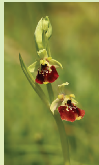
Neke od orhideja plijene ljepotom svojih cvjetova