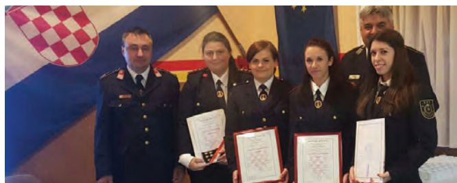
Članice DVD-a Gornja Šemnica primile su diplome o uspješno završenom osposobljavanju

Nije izostalo ni sudjelovanje u obilježavanju blagdana sv. Florijana, u hodočašću na Mariji Bistrici, proslavi obilježavanja otkrivanja spomenika Lijepoj našoj, 90. obljetnici pobratimskog društva PGD Pristava i 140. godišnjice DVD Krapina. Uz sve to održana je svečanost blagoslova vatrogasnog vozila, održani su edukacijski satovi s učenicima područne škole i sat vatrogastva u organizaciji savjeta mladih. Tradicionalno članovi i članice DVD-a Gornja