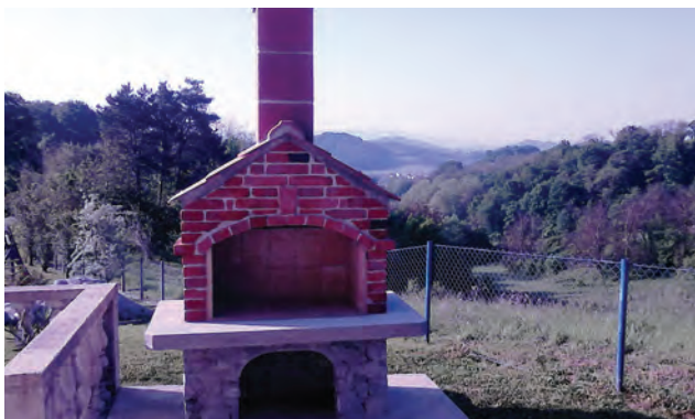
Pečenjara je spremna za uporabu

Završeni su radovi na izgradnji pečenjare kod Društvenog doma u Orehovcu Radobojskom. Nakon što su šamotirana ložišta, postavljen dimnjak i držači za rešetke pečenjara je spremna za