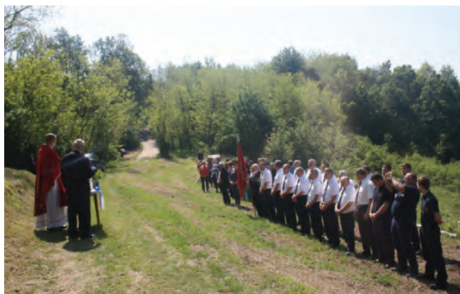
Misa kod kaplice Sv. Florijana kod Pilja u Cerju

slavlje istaknuo je kako uz pomoć svog nebeskog zaštitnika vatrogasci nesebično i neustrašivo vrše sve zadaće pomažanja svojim bližnjima u nevolji; u tome i jest vrijednost vatrogasnog poziva. Pozvao je prisutne na zajedničku molitvu sv.