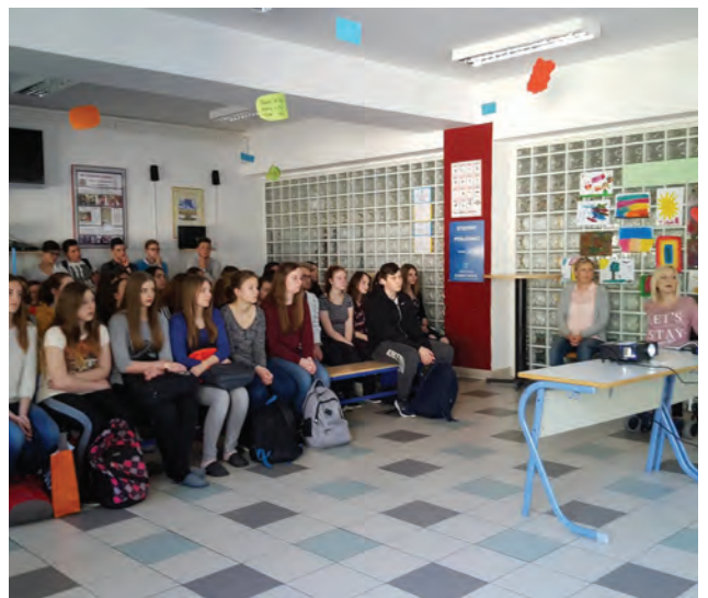
Radionice su održavane i u srednjim školama

moć PowerPoint prezentacije učenici su se pobliže upoznali sa invaliditetom, vrstama invaliditeta, pomagalima koja se najčešće koriste, važnost pristupačne okoline te na kraju sa mogućnostima osoba s invaliditetom. Na kraju radionice učenici su ispunjavali evaluacijski listić kako bi se mogla napraviti i procjena cijeloga projekta po njegovom završetku. Svakom učeniku podijelili smo jednu čokoladu i letak, a profesoru šalicu i notes kao znak pažnje. Završetkom projekta Udruga će obuhvatiti više od 800 učenika, što uključuje 9 osnovnih matičnih škola, 5 područnih, 2 srednje i 2 vrtića, s područja Krapinsko – zagorske županije. Provedbu projekta podržavaju Osnovna škola Gornje Jesenje i Centar za socijalnu skrb Krapina, podružnica Obiteljski centar koji su i partneri na projektu.