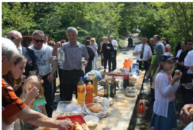
Nakon misnog slavlja vatrogasci su se družili sa mještanima

su se vatrogasci i mještani kako bi u zajedništvu zahvalili i molili nebeskog zaštitnika vatrogasaca da ih, kao i do sada, čuva na njihovim zadaćama. Župnik Danijel Herceg koji je i sam vatrogasac, predvođeci misno