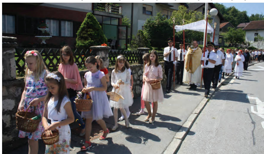
Djevojčice su putem bacale latice cvijeća pred Presvetim

Svečanom procesijom i misom u četvrtak, 26. svibnja proslavljen je blagdan Tijelova u župi Jesenje. U procesiji je sudjelovalo mnoštvo vjernika, vatrogasci u svečanim odorama koji su nosili baldahin, članovi AKUD-a u narodnim nošnjama, ovogodišnji prvopričesnici i ostali mještani. Procesija je od župne crkve krenula do raspela u centru Gornjeg Jesenja i natrag, a cijelim putem djevojčice su iz svojih košarica bacale latice cvijeća pred Presvetim. Uz pobožne pjesme sudionici su molili za svoje obitelji, polja, vinograde... Kroz upućene molitve župnik Danijel Herceg podsjetio je sudionike na važnost blagdana Tijelova, blagdana Presvetog tijela i krvi Kristove koji ukazuju na Božju prisutnost među nama. Značenje ove procesije je da bismo na poseban način uputili molitve za Božju pomoć i zaštitu, istaknuo je među ostalim župnik Herceg.