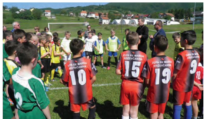
Tereni NK Radoboj sunčanog subotnjeg prijedpodneva 21. svibnja bili su prepuni prvopričesnicima iz župa Zagrebačke županije koji su sudjelovali na malonogometnom turniru