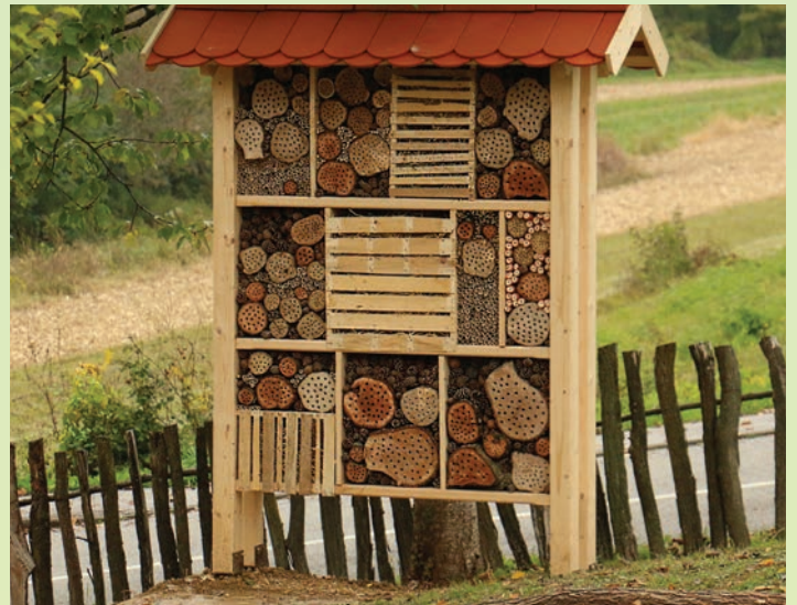
Hotel za kukce u Radobojskom trnacu ima više prostora za raznovrsne korisne kukce

Ličinka bubamare na dan pojede i do 600 biljnih ušiju. Bubamare prezimljavaju na mjestima gdje nema opasnosti od mraza, ispod biljnih ostataka, ispod kore ili zemlje, u busenima trave. Preporučuje se u hotel za kukce dodati šupljikave elemente kako bi se tamo mogle sakriti preko zime. Solitarne pčele ili pčele samotarke vrijedni su oprašivači voćnjaka, koje ne žive u košnicama kao pčele medarice, ne roje se, nego žive samostalno i sve rade same. Manje su od pčela medarica i miroljubive su - ne bodu. Tijelo im je prekriveno gustim dlakama, pogotovo na trbuhu i upravo tu skupljaju pelud koji prenose onda u gnijezda gdje spremaju hranu za svoje potomstvo, a na taj način istodobno oprašuju i voćke. Zovu se još i pčele zidarice, jer svoja gnijezda kamo odlažu jajašca pregrađuju i zatvaraju blatom. Učinkovitost pri oprašivanju voćaka jedne ženke solitarne pčele