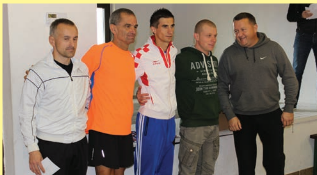
Najbolji su dobili nagrade

Nakon utrke održano je druženje na kojem su uručene nagrade najboljima.