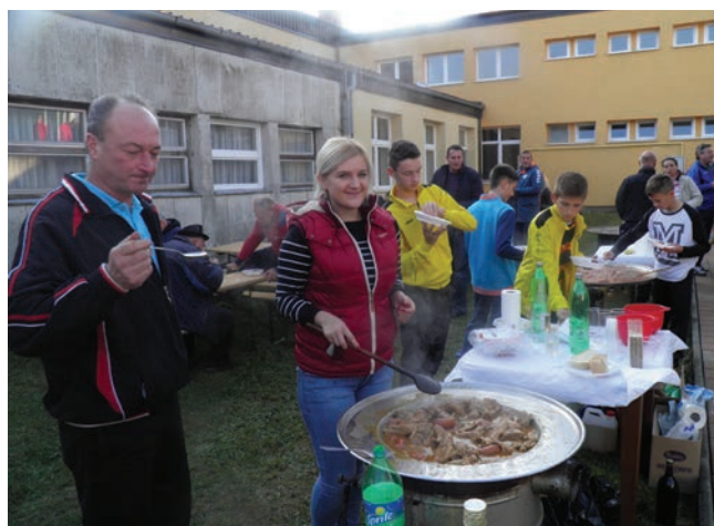
Sve je više stručnjaka za pripremanje kotlovine, pa nije rijetkost da im se pridružuje i sve veći broj pripadnika ljepšeg spola

je tradicionalno druženje susjednih općina i mjesnih odbora s područja Općine Radoboj.