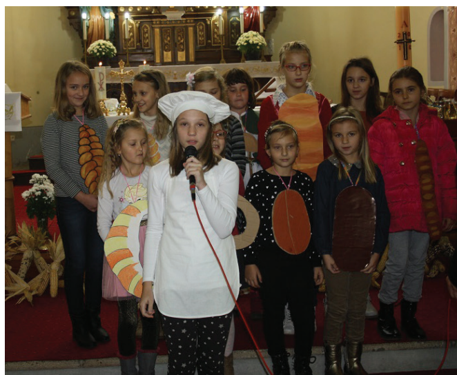
Učenici četvrtog razreda OŠ izveli su prigodni recital