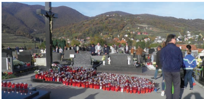
Uz svijeće na grobovima svojih najdražih posjetitelji groblja zapalili su i brojne lampaše ispred središnjeg križa

Predstavnici ministarstava obrane i unutarnjih poslova, udruga proizašlih iz Domovinskog rata, Krapinsko-zagorske županije i Općine Radoboj, te članovi obitelji poginulih i umrlih hrvatskih branitelja posjetili su njihove grobove na radobojskom groblju u petak 28. listopada, te uz prigodne riječi sjećanja zapalili svijeće.