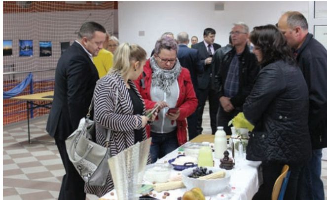
Obitelj Kiseljak, jedna je od rijetkih koja se još uvijek na našem području bavi stočarstvom. Njihovi mliječni proizvodi kao i proizvodi ostalih obiteljskih gospodarstava privukli su pozornost prisutnih