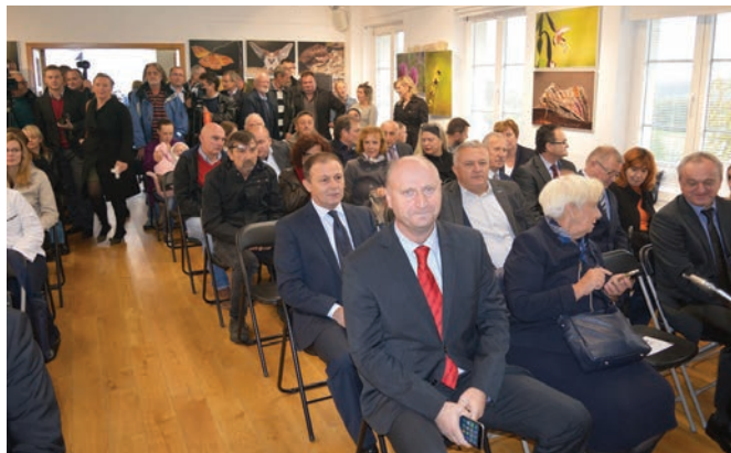
Proslavama Dana Općine Radoboj svake godine odazovu se brojni uzvanici