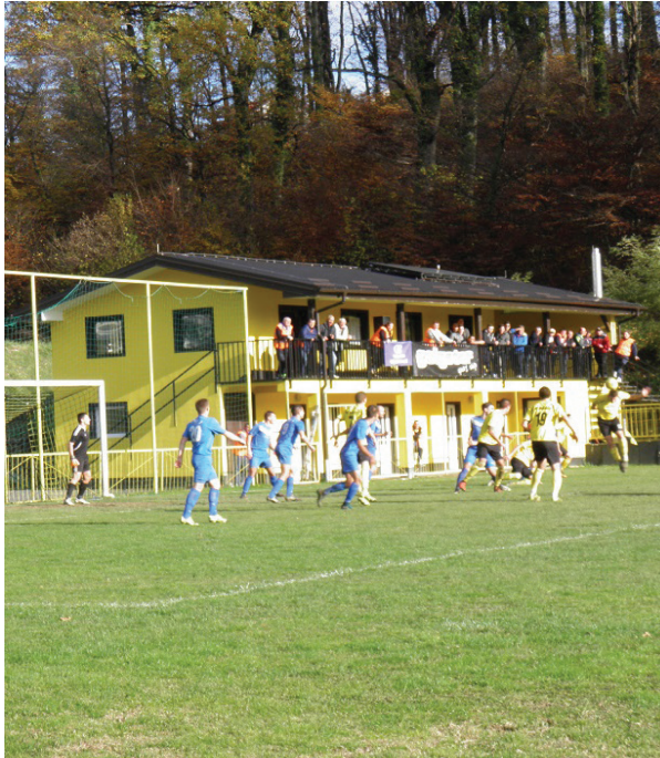
Nakon što je već u 18 minuti isključen jedan igrač Mladosti i gola kojeg je glavom nakon kornera zabio Kantolić pojavila se među domaćim navijačima nada u pobjedu, ali ispalo je samo 2:2.

Do kraja jesenskog dijela natjecanja preostaje im još utakmica u Karlovcu i kod kuće protiv Poleta, a onda valja razmišljati kako nastaviti natjecanje u proljeće.