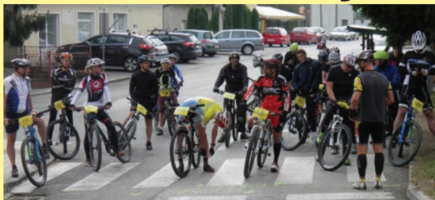
Start utrka biciklista u centru Radoboja

U organizaciji KASK Krapina, a pod pokroviteljstvom Školskog sportskog društva „Mirna“ Radoboj i Općine Radoboj u subotu 9. listopada održana je prva u nizu sportska priredba kojom je obilježen Dan općine Radoboj. Unatoč lošem vremenu na devetoj po redu rekreativno - brdskoj biciklističkoj utrci „Rimska cesta“ okupilo se tridesetak sudionika. Start i cilj bio je u centru Radoboja, a trasa staze dužine 12 kilometara imala je velikih uspona i blatnjavih šumskih dijonica. Biciklisti su za nešto više od pola sata biciklima prošli dio Rimske ceste do Sv. Jakova,