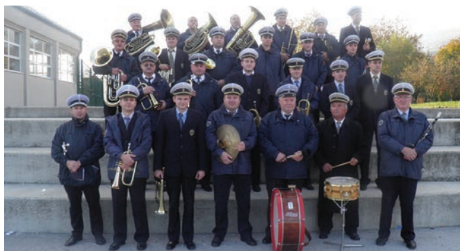
Svi radobojski glazbenici iako članovi dvaju puhačkih orkestara za Dan su Općine nastupili zajedno

dvoranu OŠ Side Košutić. Zahvaljujući Radiju Kaj i Borisu Pavlekoviću u Radoboj su devetu godinu za redom došli mladi koji žele pokazati da imaju talenta i volje za javne nastupe i nadaju se da će jednog dana biti među zapaženim pjevačkim