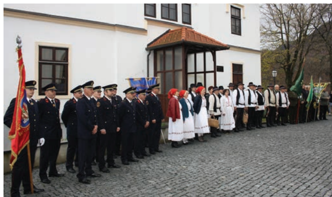
Članovi udruga sa područja Jesenja na misu Zahvalnicu stigli su sa zastavama, svojim odorama i nošnjama