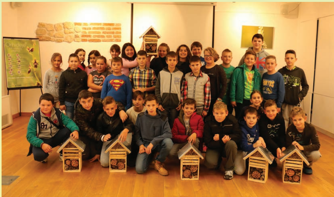
Učenici OŠ Side Košutić Radoboj svojim su se doprinosom pridružili akciji zaštite životinjskog svijeta izradom posebnih kućica