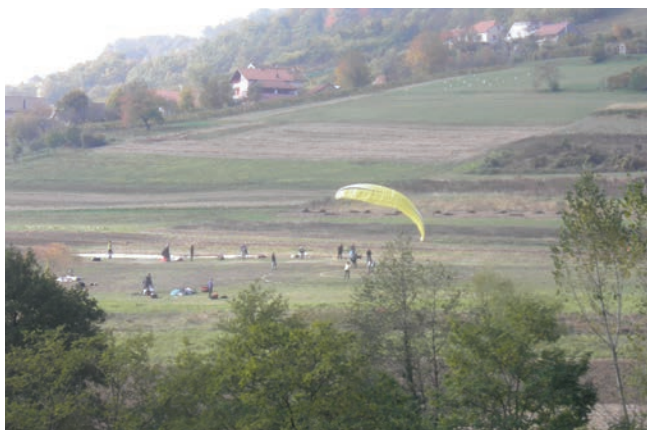
Paragladjeri su se natjecali u disciplini precizno slijetanje

dan je započeo sa državnim natjecanjem u preciznom slijetanju parajedrilicom. U 13 sati na prostoru igrališta Osnovne škole Side Košutić Radoboj započelo