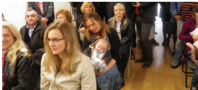
Ove su godine i mlade mame došle na svoje, dobile su klupu za dojenje, a sa svojim najmlađima bile su i na svečanosti obilježavanja Dana općine