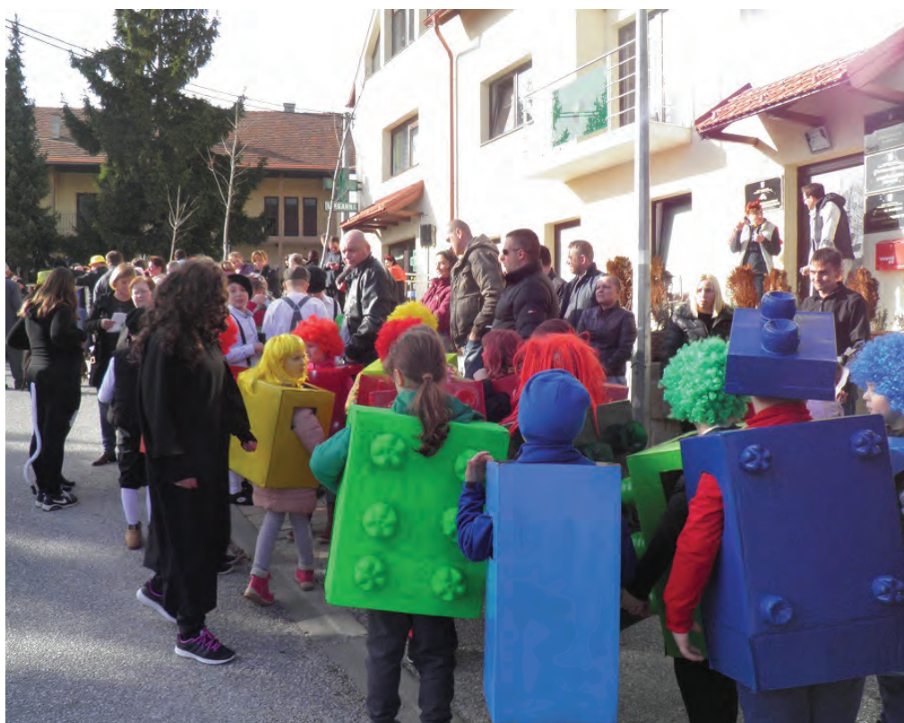
Središte Radoboja bilo je mjesto okupljanja maskiranih i nemaskiranih sudionika fašničke spelancije

Uz fašnik je pokrenuto izdavanje i humorističkog glasila «Pike» koji objavljuje prikaze šaljivih događanja između dva fašnika. U realizaciji fašničkih spelancija veliki su doprinos dali učenici, učiteljice i učitelji Osnovne škole Side Košutić, radobojske limene glazbe kao i brojni po-