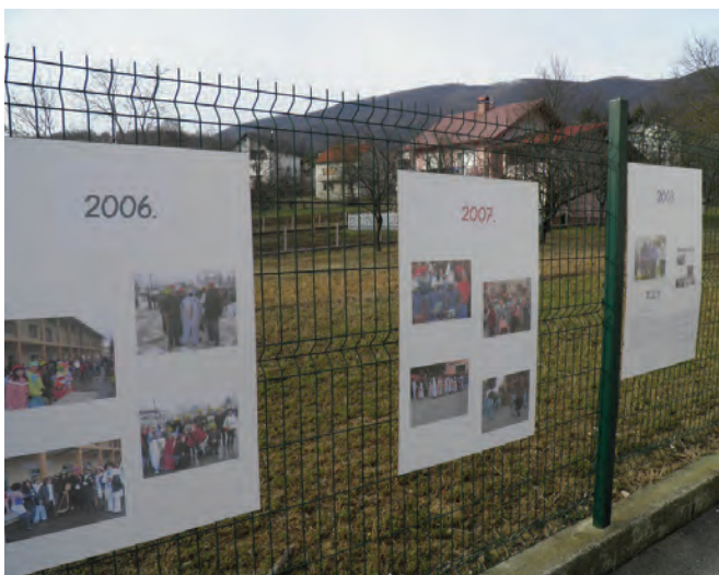
Uz nastup maskiranih grupa i pojedinaca priređena je i izložba slika o dosadašnjim fašničkim događanjima u Radoboju

igralištu, gdje se održavala središnja ceremonija. Nakon nastupa brojnih maskiranih grupa i pojedinaca sudilo se fašniku, koji je na kraju proglašen krivim za sve nedaće i spaljen. Podijeljene su nagrade za najbolje grupe i pojedince, a sve je završilo uz kuhane kobase, čaj, vino i ugodno raspoloženje. Ove je godine uz sve ostalo priređena i izložba povodom održavanja fašničkih priredbi, izložena «Pikca» i nastupa Radobojskih mažoretkinja. Uz veliko zalaganje članica i članova KUD-a «Zagorec» iz Radoboja, OŠ Side Košutić i Općine Radoboj, glazbe «Radobojska zvona» i brojnih pojedinaca Radoboj se još jednom svrstao u krug onih sredina koje znaju i mogu organizirati zanimljive i hvale vrijedne priredbe na opće zadovoljstvo velikog broja građana.