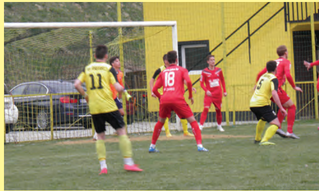
Detalj s utakmice u Radoboju igrane protiv Zagreba II.

greba 0:3 i Moslavine 1:2. NK Radoboj je pretposljednji na prvenstvenoj ljestvici i male su šanse da se i iduće sezone natječe u istom natjecateljskom rangu, jer je već sada zaostatak za ostalim klubovima teško nadoknadiv, iako do kraj natjecanja ima još puno susreta.