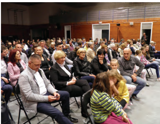
Brojna publika u sportskoj dvorani oduševljena je pozdravila poznatog filmskog, televizijskog i kazališnog glumca Ljubomira Kerekeša