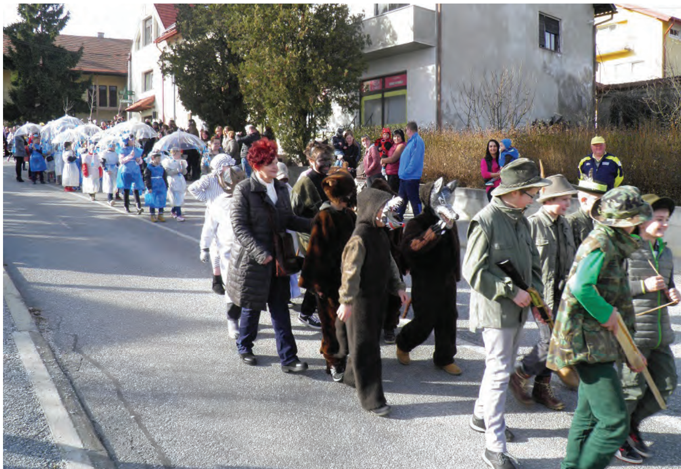
Raznovrsne maske bile su dio fašničke povorke