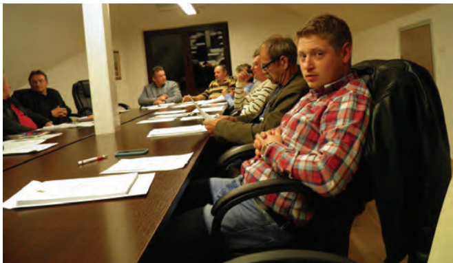
Dio općinskih vijećnika na posljednjoj sjednici u ovom sastavu

Na dnevnom se redu našlo čak 18 točaka među kojima su i odluke o korištenju namjenskih sredstava Fonda za razvoj brdsko - planinskih područja, o kupnji zgrade bivših učiteljskih stanova u Radoboju, o nerazvrstanim cestama i o usvajanju pročišćenog teksta prostornog plana uređenja Općine Radoboj. Prihvaćeni su i izvještaji o radu poljoprivrednog redara za 2016. godinu, o radu Sportske zajednice, Odbora za međugeneracijsku solidarnost i izvještaj općinskog načelnika o izvršenju plana gospodarenja otpadom na području Općine Radoboj.