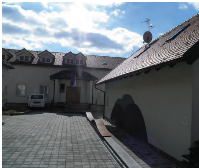
Jedan od dobrih poteza dosadašnje općinske vlasti, Uređenje muzeja i Zavičajne zbirke

Upitani kako ocjenjuju rad općinskog načelnika Anđelka Topolovca njih 87 od ukupno 250 anketiranih dalo mu je čistu peticu, a daljnjih 88 četvorku. Jedinicu je dobio od njih 13, a dvojku od njih 19 dok su mu 43 dala trojku, što u prosjeku iznosi 3,87. Glasači HNS-a načelniku su u prosjeku dali ocjenu 4,27, simpatizeri SDP-a 4,00, glasači HDZ-a načelnika ocjenjuju sa prosječnom ocjenom 3,27, a oni iz HSS-a sa 3,17. Zamjenik načelnika Stjepan Sirovec dobio je prosječnu ocjenu od 3,74. Čistu peticu dobio je od 67 anketiranih, četvorku od 79, trojku su mu dala 70, dvojku 20 a jedinicu 7 anketiranih. Glasači HNS-a zamjeniku načelnika dali su prosječnu ocjenu 4,23, SDP-a 4,00, HDZ-a 3,32 i HSS-a 3,00. Rad Općinskog vijeća anketirani su ocijenili s prosječnom