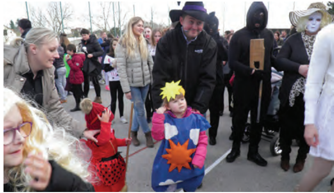
Za najbolje maske dodijeljene su nagrade tako je nagrađena i najmlađa maska «sunce» i grupa odraslih «čokolinda»

jedinci koju su u skupinama ili pojedinačno sudjelovali u priredbama.