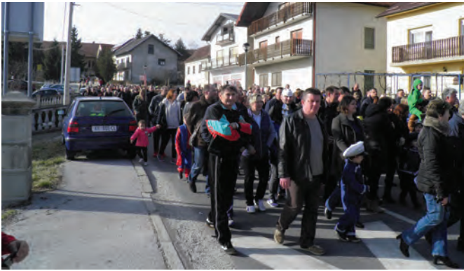
Brojni posjetitelji također su bili u povorci