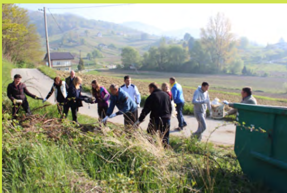
Sudionici «Zelene čistke» sakupili su oko 10 kubika raznovrsnog otpada

Uz Dan planeta Zemlja u subotu 22. travnja u Radoboju je održana tradicionalna, šesta po redu Zelena čistka. Članovi udruga građana, djelatnice i djelatnici Upravnog odjela i dosadašnji članovi Općinskog vijeća tijekom akcije u predjelu zaselka Miljani sakupili su oko 10 kubika raznog otpada koji je sortiran i zbrinut zahvaljujući Krakomu iz Krapine. Zelena čistka je inače volonterska akcija čišćenja ilegalnih odlagališta i doprinosi zaštiti okoliša.