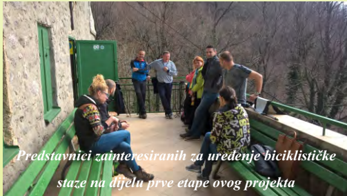
Predstavnici zainteresiranih za uređenje biciklističke staze na dijelu prve etape ovog projekta

Grad Krapina, općine Jesenje i Radoboj, Turistička zajednica Grada Krapine, Javna ustanova za upravljanje zaštićenim dijelovima prirode Krapinsko-zagorske županije, KulTuRa Radoboj, Udruga KASK Krapina, Planinarsko društvo Strahinjčica Krapina, Zdruga BikeLab iz Maribora i Lokalna akcijska grupa Zeleni bregi udružili su se da bi