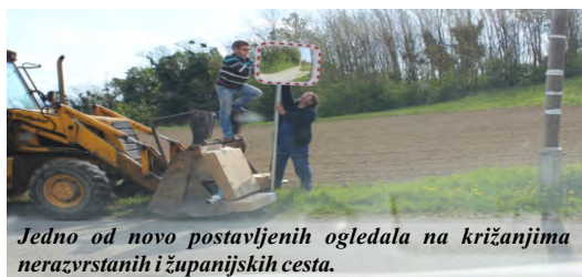
Jedno od novo postavljenih ogledala na križanjima nerazvrstanih i županijskih cesta.

Vozači će se tako lakše i sigurnije uključivati u promet na cestama višeg ranga, a za nadati se je, da će ova ogledala biti duljeg vijeka od onih koja su već ranije postavljena, ali su nekome smetala, pa ih je nekoliko razbijeno.