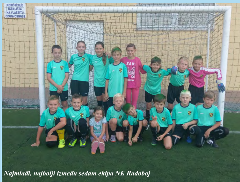
Najmlađi, najbolji između sedam ekipa NK Radoboj