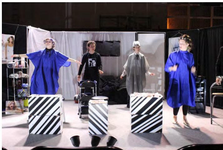
Ove su godine kazališnu predstavu u Radoboju uz proslavu Dana Općine imali amateri iz Lobora

U nedjelju 22. listopada 2017. godine u sklopu programa obilježavanja Dana Općine Radoboj u sportskoj dvorani Osnovne škole Side Košutić Radoboj održan je dramsko - glazbeni program. Unatoč iznimno lošim vremenskim uvjetima najhrabriji posjetitelji mogli su uživati u kvalitetnom kulturnom programu kojeg su pripremili vrijedni izvođači. Dramska sekcija Kulturno umjetničko društvo Lobar prikazala je predstavu pod nazivom "U raj". Suvremena komedija o događanjima iz frizerskog salona u