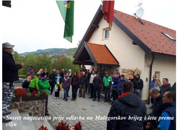
Susret natjecatelja prije odlaska na Malogorskov brijeg i leta prema cilju

reprezentaciju RH u preciznom slijetanju koja će ovog puta biti sastavljena od minimalno 5 članova, koji će sudjelovati na Europskom prvenstvu 2018. godine. Osim toga, natjecanje je bilo i u FAI 2 kategorije, pa su sudjelovali i piloti iz susjedne Slovenije, te Češke i Slovačke, ali i natjecatelji iz Cipra i Velike Britanije. Natjecanje je održano o organizaciji KPJ Jastreb, LK Parafreek, Hrvatskog zrakoplovnog saveza i Općine Radoboj.