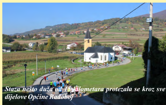
Staza nešto duža od 15 kilometara protezala se kroz sve dijelove Općine Radoboj