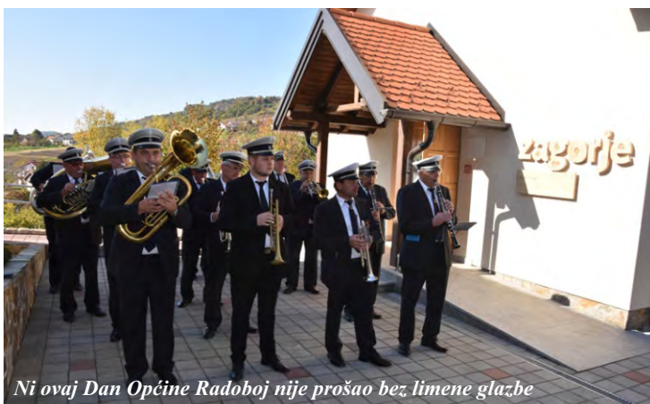
Ni ovaj Dan Općine Radoboj nije prošao bez limene glazbe