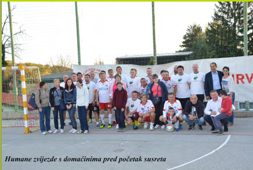
Humane zvijezde s domaćinima pred početak susreta