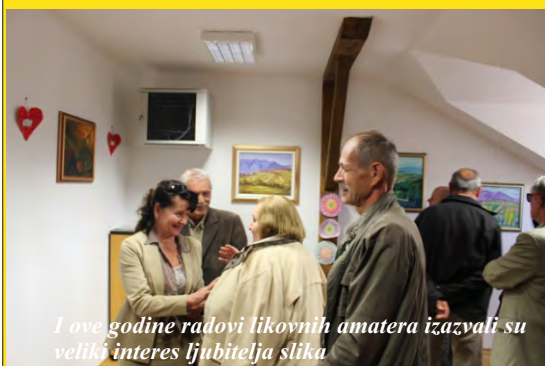
I ove godine radovi likovnih amatera izazvali su veliki interes ljubitelja slika

Vrijedni slikari iz Hrvatskog zagorja i šire okolice već se jedanaest godina okupljaju u Radoboju kako bi na platna uz pomoć boja i kista prenijeli pejzaže i prepoznatljive motive radobojskog kraja.