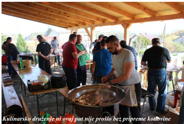
Kulinarsko druženje ni ovaj put nije prošlo bez pripreme kottovine

U subotu 21. listopada 2017. godine u Orehovcu Radobojskom održano je tradicionalno sportsko - kulinarsko druženje susjednih općina i mjesnih odbora s područja Općine Radoboj. Tradicionalno druženje u sklopu održavanja Dana Općine Radoboj održano je na prostoru igrališta i društvenog doma u Orehovcu Radobojskom. Okupljene ekipe pripremale su kotlovinu za sve prisutne, a limena glazba „Mirna“ i glazbeni sastav B&B veselim tonovima upotpunjavali su druženje.