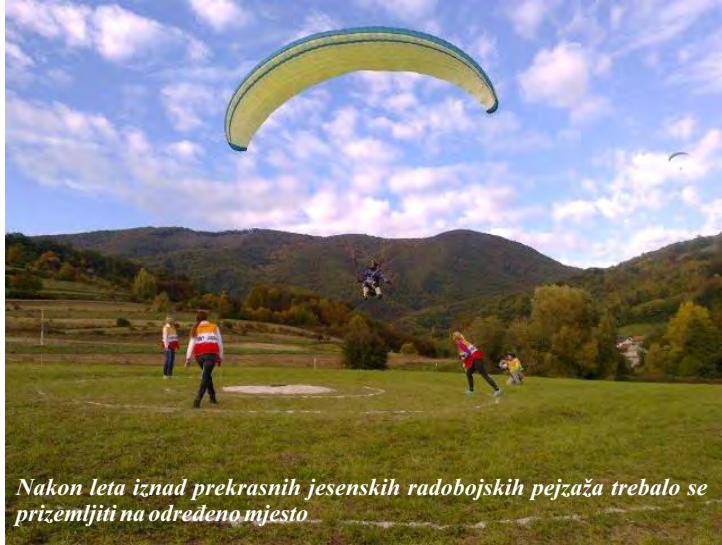
Nakon leta iznad prekrasnih jesenskih radobojskih pejzaža trebalo se prizemljiti na određeno mjesto

Ove godine održano je uz proslavu Dana Općini tradicionalno Otvoreno državno prvenstvo u preciznom slijetanju pod nazivom „RADOBOJ OPEN 2017“. Bilo je to deseto po redu natjecanje u Radoboju, a održavalo se po lijepom jesenskom vremenu u nedjelju 8. listopada. Na poletištu „Malogorski“ brijegu iznad samog centra Radoboja skupilo se 43 natjecatelja koji su u 6 serija lovili što bolje rezultate i plasman. Ovo natjecanje bilo je izlučno natjecanje za