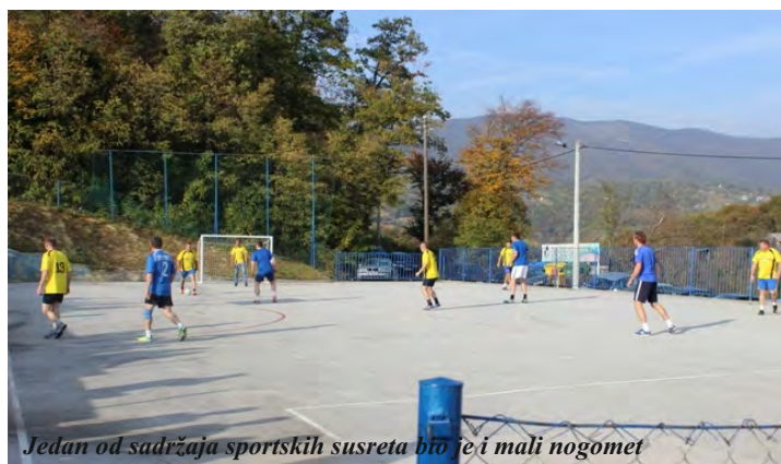
Jedan od sadržaja sportskih susreta bio je i mali nogomet

Ekipe mjesnih odbora s područja općine Radoboj zaigrale su i mali nogomet u kojem su redom najuspješnije bile ekipe mjesnog odbora Radoboj I i II, Jazvina i Orehovca Radobojskog, te ekipa Strahinja Radobojskog. Revijalnu utakmicu odigrale su i ekipe Općine Radoboj i Đurmanca.