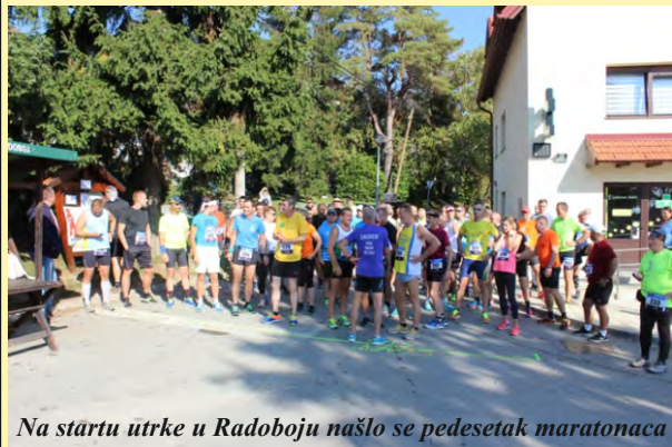
Na startu utrke u Radoboju našlo se pedesetak maratonaca

U nedjelju 15. listopada 2017. godine po jubilarni 10. put održan je radobojski maraton - „Radobojska uspinjača 2017“. Na već poznatoj i