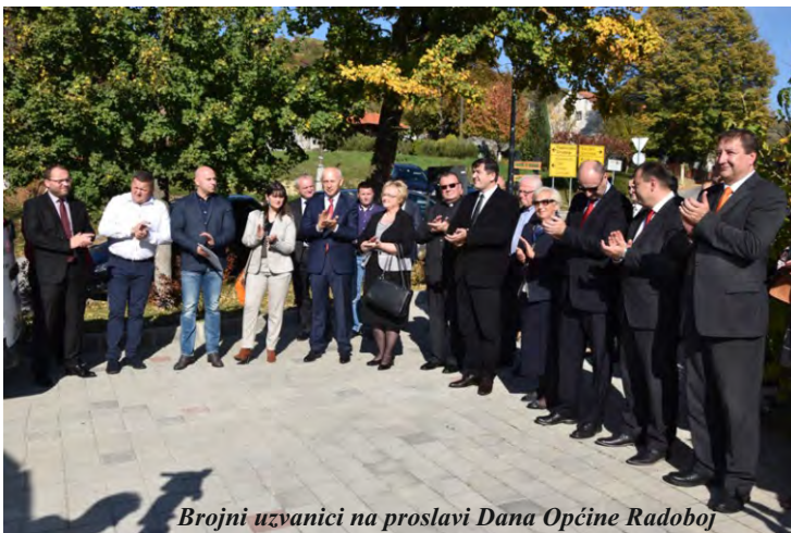
Brojni uzvanici na proslavi Dana Općine Radoboj